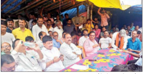
धरना पर बैठे लोग एवं पुलिस और पदाधिकारियों के विरोध में रहा मेराल बंद