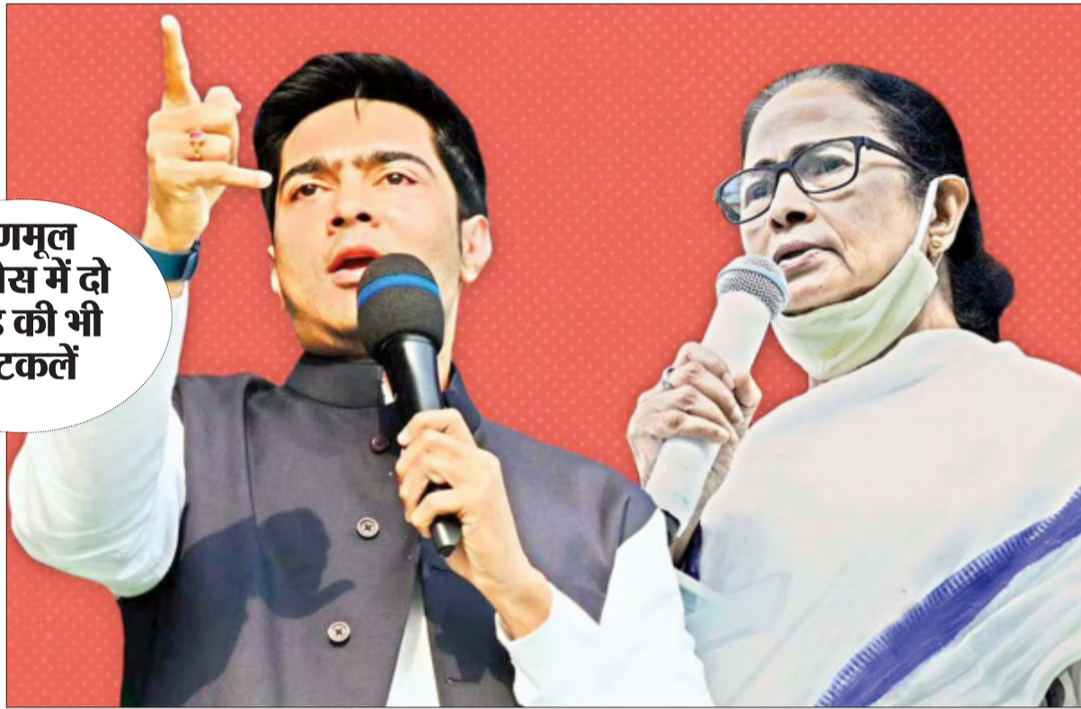
तुणमूल कांग्रेस में दो फाड़ की भी अटकलें

बताया जाता है कि इस पोस्टर कांड के पीछे ममता बनर्जी और उनके भतीजे अभिषेक बनर्जी के बीच पैदा हुई खिंट है। हालांकि दोनों के बीच मतभेद की यह पहली घटना नहीं है। पहले भी अभिषेक बनर्जी और ममता बनर्जी में तकरार की खबरें आ चुकी हैं। इसके पीछे की वजह यह है कि अभिषेक बनर्जी ने एक व्यक्ति, एक पद की नीति को बढ़ावा देने का मन बनाया था। इसके तहत उनका कहना है कि पार्टी एक व्यक्ति एक पद की नीति को लागू करे। वहीं सीएम ममता बनर्जी के समर्थक और पार्टी के पुराने नेताओं ने इस नीति का विरोध किया था। इसके विरोध में अभिषेक बनर्जी के समर्थकों ने सोशल मीडिया में अभियान भी चलाया था। बंगाल की राजनीति के