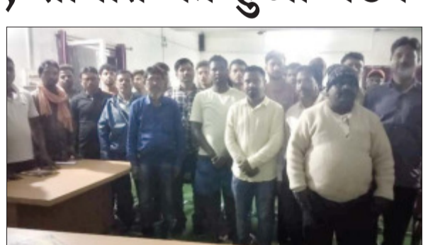
दुर्गापूजा को लेकर आयोजित बैठक में मौजूद ग्रामीण।