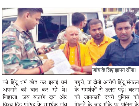
जांच के लिए ज्ञान सौंपा।