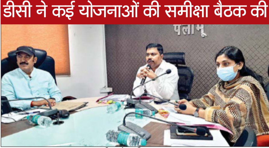
डीसी ने कई योजनाओं की समीक्षा बैठक की पीएम किसान, अमृत सरोवर, विद्यालय स्तर पर जाति प्रमाण पत्र निर्गत करने से संबंधित विस्तृत चर्चा की।