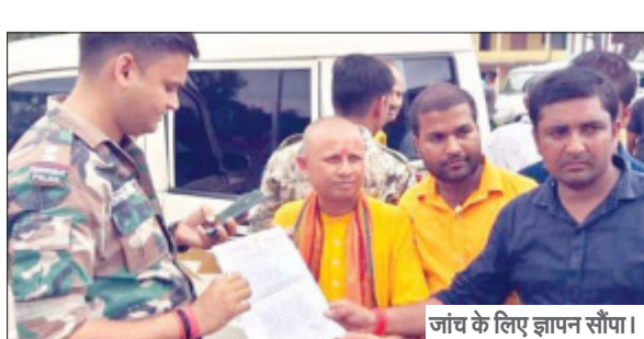
जांच के लिए ज्ञान सौंपा।