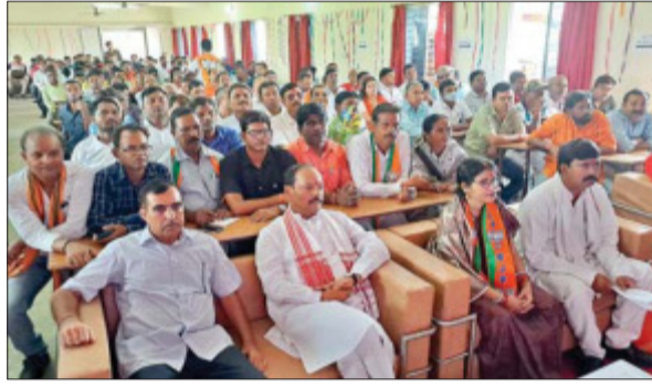
कार्यक्रम में शामिल पूर्व मुख्यमंत्री रघुवर दास व अन्य।

सिंदरी। झारखंड के पूर्व मुख्यमंत्री सह भाजपा के राष्ट्रीय उपाध्यक्ष रघुवर दास रविवार को बलियापुर पर्जन्य बीएड कॉलेज पहुंचे। यहां उन्होंने प्रधानमंत्री नरेंद्र मोदी के मन की बात कार्यक्रम को सुना। कहा कि देश के सभी नागरिकों को मन की बात सुननी चाहिए। प्रधानमंत्री नरेंद्र मोदी विश्व के लोकप्रिय नेता हैं। वो डिजिटल इंडिया पर बेहतर सोच रखते हैं। पूर्व मुख्यमंत्री ने विभिन्न योजनाओं को गिनवाते हुए मोदी सरकार के कर्णों का बखान किया। साथ ही कहा कि उनके (रघुवर दास) के मुख्यमंत्री रहते