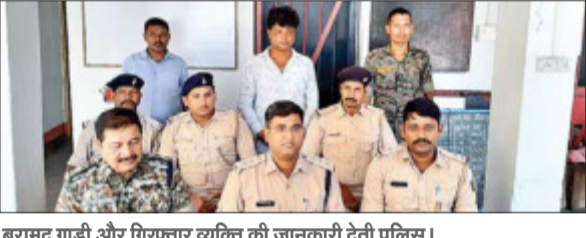
बरामद गाड़ी और गिरफ्तार व्यक्ति की जानकारी देती पुलिस।