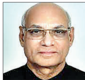
से सात्वना दी। राज्यपाल रमेश बैस ने कहा कि ऐसी घटनाओं से