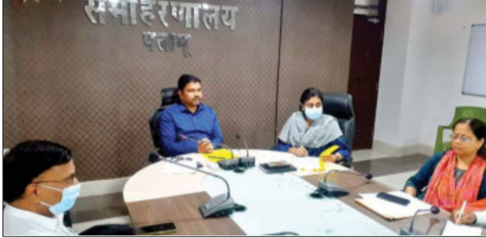
जिले में कार्यरत हिंडालको, सीसीएल राजहारा, पावर ग्रीड व ग्रामिम इंटरस्ट्रीज के