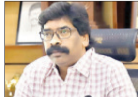
डीसी से बात की है। स्पीडी ट्रायल कराया जायेगा। किसी तरह की

रांची। मुख्यमंत्री हेमंत सोरेन ने कहा कि दुमका की घटना हृदय विदारक है। सभ्य समाज में ऐसी घटनाओं के लिए जगह नहीं है। हमारी कोशिश होगी कि आरोपी को कड़ी सजा मिले। इससे पहले स्वास्थ्य मंत्री बन्ना गुप्ता ने कहा कि सरकार गंभीर है। दोषी को बख्शा नहीं जायेगा। हमने दो बार