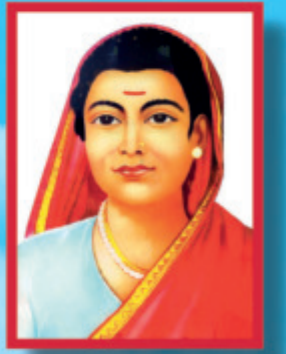
सावित्रीबाई फुले देश की पहली महिला शिक्षिका

अब झारखण्ड राज्य की लाखों किशोरियों की उम्मीदों को लगेगे पंख