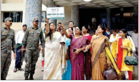
गर्भधारण से बच्चे की उम्र दो वर्ष

हजारीबाग(आजाद सिपाही)। समाज कल्याण विभाग की ओर से चलाए जा रहे पोषण माह के तहत गुरुवार को समाहरणालय परिसर में बुधवार को पहली बार आईसीएल लेंस (इम्प्लांटेबल कॉलेमर लेंस) का सफल प्रत्यारोपण किया गया। समाज कल्याण विभाग की ओर से चलाए जा रहे पोषण माह के तहत गुरुवार को समाहरणालय परिसर में बुधवार को पहली बार आईसीएल लेंस (इम्प्लांटेबल कॉलेमर लेंस) का सफल प्रत्यारोपण किया गया। समाज कल्याण विभाग की ओर से चलाए जा रहे पोषण माह के तहत गुरुवार को समाहरणालय परिसर में बुधवार को पहली बार आईसीएल लेंस (इम्प्लांटेबल कॉलेमर लेंस) का सफल प्रत्यारोपण किया गया। समाज कल्याण विभाग की ओर से चलाए जा रहे पोषण माह के तहत गुरुवार को समाहरणालय परिसर में बुधवार को पहली बार आईसीएल लेंस (इम्प्लांटेबल कॉलेमर लेंस) का सफल प्रत्यारोपण किया गया।