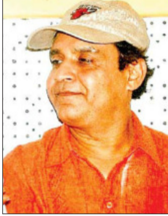
अलावे उनकी आने वाली फिल्म खेला होबे और तेरे बिन जी सकेगे न हम

पहुंचकर उन्होंने मां छिन्नमस्तिका की पूजा अर्चना कर उनका आशीर्वाद प्राप्त किया। इस दौरान उन्होंने दामोदर भैरवी संगम स्थल का जायजा भी लिए। मौके पर उन्होंने पत्रकारों से बातचीत करते हुए कहा कि यहां का मनोरम वादियां काफी मनमोहक है, जो बर्बश लोगों को अपनी ओर खींचती है। उन्होंने आगे कहा कि झारखंड की मनोरम वादियों में भी फिल्मों की शूटिंग की असीम संभावनाएं हैं। उन्होंने आगे कहा कि उनकी अपकमिंग फिल्म सबवे हैं। जिसमें मुख्य कलाकार के तौर पर रवि किशन जी ने अभिनय किया। जो 09 सितंबर को ही रिलीज होने जा रही है। इसके