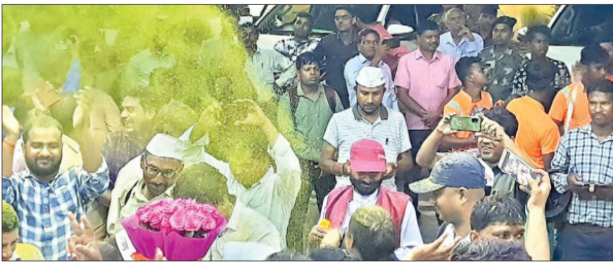
राज्य सरकार द्वारा मंत्रिपरिषद की बैठक में गुरुवार को पुरानी पेंशन योजना बहाल करने की स्वीकृति दिये जाने के बाद झारखंड मंत्रालय परिसर में सरकारी कर्मचारी संघ के लोगों ने मुख्यमंत्री हेमंत सोरेन का जोरदार स्वागत किया। इस अवसर पर ढोल-नगाड़े की आवाज से गुंजा मंत्रालय परिसर।

रांची। राज्य सरकार ने अंशदाई पेंशन योजना समाप्त कर राज्य कर्मियों के लिए सरकार के इस फैसले पर कर्मचारी संगठनों ने खुशी जाहिर की है और उन्हें आभार भी दिया है। पुरानी पेंशन योजना को लागू करने का फैसला लिया है। कर्मचारी खुशी से झूम उठे। मिठाई बांटी और ल्योहार से पहले ही गुलाल अबीर खेलकर अपनी खुशियां मंगाने लगे। गुरुवार को ढोल नगारों के साथ कर्मचारी संगठन के सदस्य झारखंड मंत्रालय पहुंचे थे। कैबिनेट के बाद जैसे ही सीएम बहार निकले सभी सदस्य जोरदार स्वागत कर आभार जताया। बता दें कि इस संबंध में 15 जुलाई 2022 को ही मंत्रिपरिषद की बैठक में पुरानी पेंशन योजना के तहत पेंशन भुगतान के निमित्त एक स्टैंडर्ड ऑपरेटिंग प्रोसीजर विकसित किये जाने के लिए विकास आयुक्त