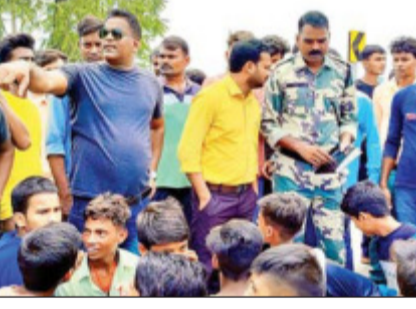
छतरपुर/पलामू (आजाद सिपाही)। शिक्षकों की लापरवाही से छतरपुर के मदनपुर उत्कर्मित मध्य विद्यालय के 117 छात्रों का रिजल्ट पेंडिंग हो गया। जिसके बाद