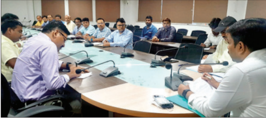
ऐसे में तब समय में सभी का जाति प्रमाण पत्र बनाना सुनिश्चित करें उन्होंने सभी अंचलाधिकारी से अभियान को प्राथमिकता के आधार पर पूरा करने की बात कही। उपायुक्त ने सीएससी मैनेजर