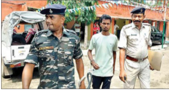
सिरफिरे आशिक को गिरफ्तार कर ले जाती पुलिस।