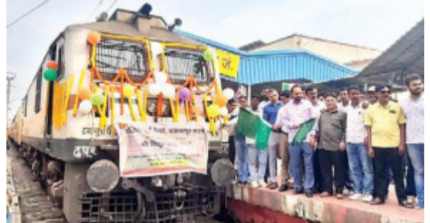
सांसद विद्युत वरण महतो ने हटी झंडी दिखाकर रवाना किया