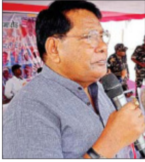
करमा पर्व संध्या पर आयोजित कार्यक्रम में शामिल हुए राज्य के मंत्री रामेश्वर उरांव, राज्यसभा सांसद धीरज प्रसाद साहू व अन्य।