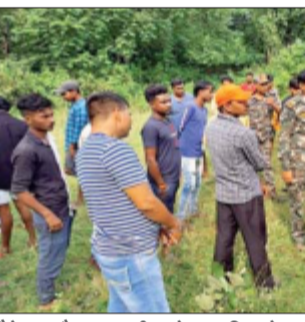
मौके पर मौजूद स्थानीय लोग व पुलिस के जवान।