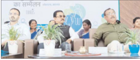
माताओं के सम्मेलन में शामिल हुए राज्यसभा सांसद धीरज साहू व अन्य।

आजाद सिपाही संवाददाता लोहरदगा। वायु प्रदूषण के गहरो संकट और उसके निपटने के उपायों को लेकर आयोजित माताओं के जागरूकता सम्मेलन में शुक्रवार को लोहरदगा के विभिन्न पंचायतों से 400 से ज्यादा महिलाएं शामिल हुईं। जिसमें चिकित्सकों के अलावा अन्य गणमान्य लोग भी मौजूद थे। इस दौरान वायु प्रदूषण के समाधान पर विचार विमर्श किया गया। सम्मेलन का आयोजन गैर सरकारी संगठन होप और स्वच्छ वायु के लिए