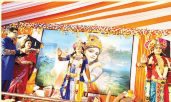
भगवान कृष्ण और भ्राता बलराम की आरती उतारते साहू परिवार के लोग