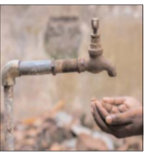
अन्य क्षेत्र के लोग गुस्से में डीवीसी के जलापूर्ति केंद्र पहुंचकर विरोध भी जताया। पदाधिकारी डीवीसी

आजाद सिपाही संवाददाता मैथन। डीवीसी मैथन के जलापूर्ति केंद्र में ठेका मजदूर और ठेकेदार के बीच आपसी खींचतान के कारण मैथन आवासीय कॉलोनी के लोग परेशान हैं। शुक्रवार से जारी गतिरोध दूसरे दिन शनिवार को भी जारी रहा। मैथन के कुछ एरिया को छोड़ कॉलोनी के अन्य हिस्सों में करीब 36 घंटे बाद भी जलापूर्ति नहीं हो सकी। मैथन एरिया चार, रांची कॉलोनी सहित