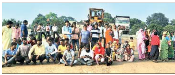
सड़क निर्माण कार्य को बंद कराकर प्रदर्शन करते ग्रामीण।

खलारी। स्टेट हाईवे अथॉरिटी ऑफ झारखंड (साज) की ओर से निर्माणाधीन पतरातू-मैक्लुस्कीगंज सड़क निर्माण कार्य को खलारी पंचायत के जी-टाइप के समीप रहने वाले ग्रामीणों ने शनिवार को बंद करा दिया। इस सड़क का निर्माण कार्य आरकेएस कंस्ट्रक्शन कंपनी नामक की ओर से कराया जा रहा है। जी टाइप के निकट रोड क्रोसिंग को लेकर ग्रामीण अपना विरोध जता रहे हैं। उक्त सड़क को एक पुलिया के बाद सीधे खलारी-बिजुपाड़ा सड़क से मिलाया जा रहा है। इसी जगह से जीटाइप कॉलोनी सहित अन्य बस्तियों तक जाने वाली मुख्य सड़क आकर खलारी-