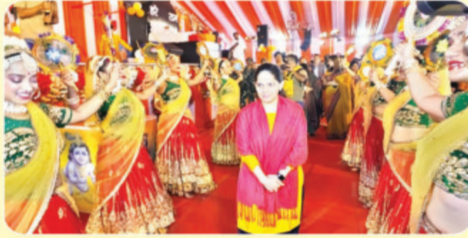
कथावाचक पूज्या जया किशोरी का भव्य स्वागत करती युवतियां