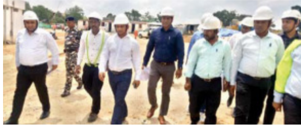
शहरी जलापूर्ति योजना का निरीक्षण करते डीसी साथ में संबंधित अधिकारी।

खूंटी। नगर पंचायत अंतर्गत निर्माणाधीन शहरी जलापूर्ति योजना एवं टोस अपशिष्ट प्रबंधन परियोजना का डीसी शशि रंजन ने शनिवार को निरीक्षण किया। सर्वप्रथम डीसी ने खूंटी शहरी जलापूर्ति योजना का निरीक्षण किया। निरीक्षण के दौरान उन्होंने