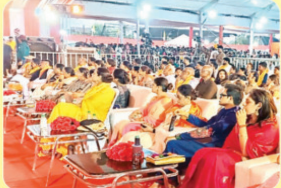
श्रीमद् भागवत कथा का रसपान करते अतिथि और श्रद्धालु

आइए : - आप भी सपरिवार अमृत कथा श्रीमद् भागवत का श्रवण करें। उमड़ रहा है भक्तों का जनसैलाब। फिर आप क्यों दूर हैं, आप भी हजारों हजार की संख्या में पहुंच कर कथा का अमृतपान करें एवं अपने जीवन को करें धन्य-धन्य।