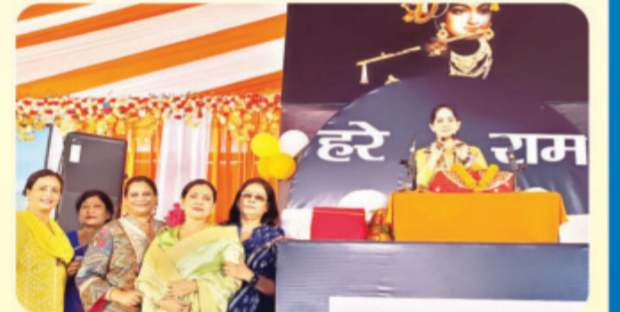
कथा का श्रवण करते साहू परिवार की महिलाएं

के द्वारा लोहरदगा के कॉलेज रोड, बरवाटोली स्थित ललित नारायण स्टेडियम में 5 से 11 सितम्बर 2022 तक (सात दिन) अपराह्न 3:00 बजे से संध्या 6:00 बजे तक