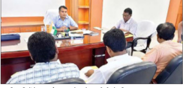
पदाधिकारियों के साथ बैठक करते लातेहार डीसी भोर सिंह यादव।

आजाद सिपाही संवाददाता लातेहार। मुख्यमंत्री स्वास्थ्य सहायता योजना का लाभ प्रदान करने को लेकर शुक्रवार को डीसी भोर सिंह यादव की अध्यक्षता में समिति की बैठक हुई। जिसमें मुख्यमंत्री स्वास्थ्य सहायता योजना के तहत अनुदान राशि के लिए प्राप्त आवेदनों को पेश किया गया। आवेदनों की समीक्षा के बाद कुल 52 आवेदनों का अनुमोदन किया गया। जिसमें अनुसूचित जाति के 10, अनुसूचित जनजाति के आठ और पिछड़ी जाति के 34 आवेदकों को मुख्यमंत्री स्वास्थ्य सहायता योजना का लाभ देने के लिए अनुमोदन दिया गया। अनुमोदित 52 आवेदनों में से छह कैसर पीड़ित मरीजों के भी आवेदन हैं। डीसी ने आईटीडीए के परियोजना निदेशक को