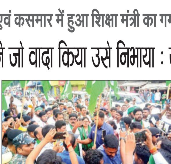
पेटरवार में शिक्षामंत्री का गर्मजोशी से स्वागत करते झामुमो कार्यकर्ता व अन्य।

मैं ही पहला आंदोलनकारी हूँ जिसे इस आंदोलन के कारण तीन महीने तक जेल में भी रहना पड़ा था। हमने वादा किया था कि खतियान आधारित स्थानीय नीति झामुमो सरकार जल्द लागू करेगी जिसे मंगलवार को हेमंत सरकार के नेतृत्व में कैबिनेट ने पारित किया। साथ ही ओबीसी का आरक्षण 14 से बढ़ाकर 27 फीसदी करने संबंधी प्रस्ताव पारित किया।