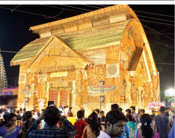
आरआर स्पॉटिंग क्लब दुर्गा पूजा समिति, रातू रोड का पंडाल : जल-जंगल और जमीन को बचाने का संदेश दे रहा उड़ने से बना यह पंडाल।

शनिवार की शाम पट खुलते ही मां के दर्शन को तांता सा लग गया। लोग कभी पंडाल की भव्यता तो कभी आभा बिखरती मां सहित अन्य देवी-देवताओं की प्रतिमाओं को अपलक निहारते रहे। मानव जीवन की सार्थकता को प्रदर्शित करते शहर के पूजा पंडाल सभी का मन मोहते रहे। प्रकृति संरक्षण के साथ सेफ लाइफ तक का संदेश मिल रहा। बच्चों के आउटडोर खेल को लेकर भी सजग किया जा रहा।