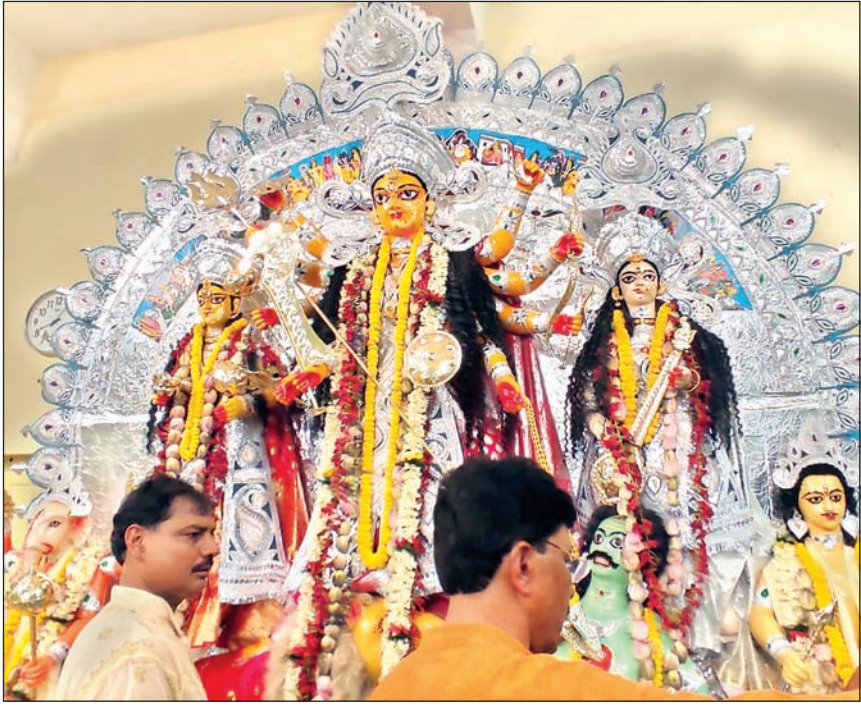
रांची : दुर्गा बाड़ी में महाशष्ठी पर सजा मां दुर्गा का दरबार और पूजा अर्चना करते श्रद्धालु।

एकवेणी जपाकर्णपुरा नगना खरास्थिता । लंबोष्ठी कर्णिकाकर्णी तैलाभ्यक्तशरीरिणी ॥ वामपादोल्लसल्लोहलताकण्टकभूषणा । वर्धनमूर्धध्वजा कृष्णा कालरात्रिभयंकरी ॥