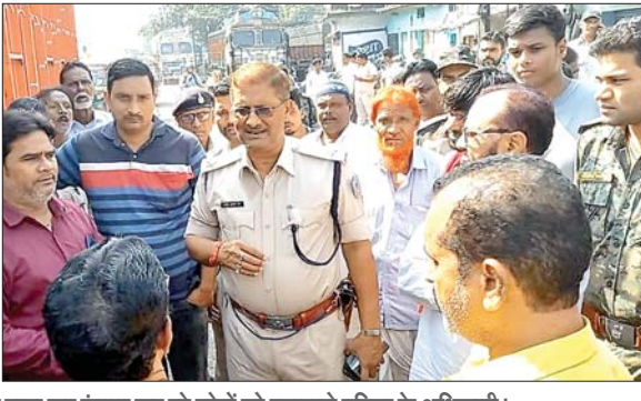
सड़क पर लिगाई गई घायल छात्रा व सड़क जाम कर रहे लोगों को समझाते पुलिस के अधिकारी।