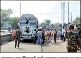
सड़क पर लिगाई गई घायल छात्रा व सड़क जाम कर रहे लोगों को समझाते पुलिस के अधिकारी।