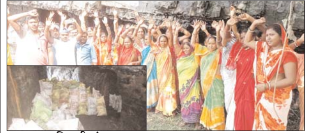
आजाद सिपाही संवाददाता

कतरास। जिला पुलिस प्रशासन के सख्त निर्देश के बावजूद बाघमारा क्षेत्र में अवैध कोयले का कारोबार चरम सीमा पर संचालित है। सोनारडीह ओपी क्षेत्र पूरे बाघमारा में नंबर वन के स्थान पर है। हाल ही में पुलिस ने सोनारडीह ओपी क्षेत्र में खानापूर्ति के लिए कुछ अवैध उत्खनन स्थल के मुहाने को बंद कर खुब फोटो सेशन करवाया, लेकिन हकीकत कुछ और ही है। पुलिस के नाक के नीचे ही खुलेआम कोयले का अवैध खनन और तस्करी हो रही है। इसका खुलासा शनिवार को सोनारडीह ओपी क्षेत्र के बहियारडीह बस्ती में अवैध उत्खनन कर तस्करी के लिए रखे गए हजारों बोरी कोयले को पकड़कर ग्रामीणों ने इस धंधे का भंडाफोड़ किया। तया है मामला शनिवार की दोपहर सोनारडीह