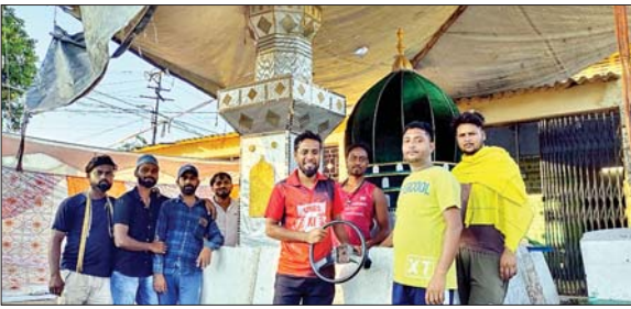
जुलूस की तैयारियों में जुटे युवक।

आजाद सिपाही संवाददाता लोयाबाद। पैगंबर मोहम्मद साहब के चौथे पैदाइश के दिन को मुस्लिम धर्मावलंबी ईद मिलादुन्नबी के रूप में हर्षोल्लास के साथ मनाते हैं। धनबाद में प्रत्येक वर्ष ईद मिलादुन्नबी पर आकर्षक जुलूस निकाले जाते हैं। जिलेभर के मस्जिदों, इमामबाड़ा से आकर्षक सजाई-सजाई झांकियां निकाली जायेंगी। रविवार को सभई झांकियां नगर भ्रमण कर स्टेशन रोड होते हुए श्रमिक चौक पर पहुंचेंगी और अपने अपने गंतव्य को वापस जाएंगी।