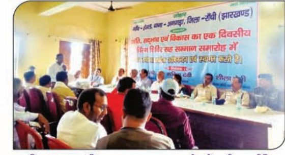
शांति सद्भाव एवं विकास सह सम्मान समारोह में सभी राजनीतिक पार्टी एवं सभी संप्रदाय को जोड़कर शांति स्थापित करना