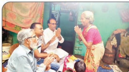
समाज के भरोसे परिवार पालने वाले को सहयोग करना

झारखंड रत्न सम्मान से सम्मानित सामाजिक कार्यकर्ता, अनगड़ा, रांची मो.नं.-6204119174