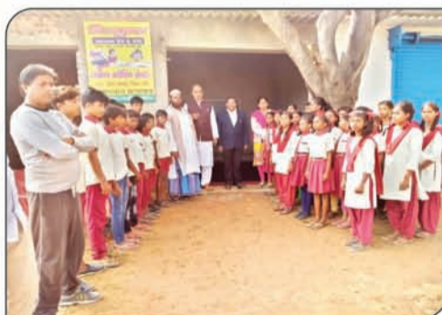
मि: शुल्क शिक्षा गरीब बच्चों तक पहुंचाना