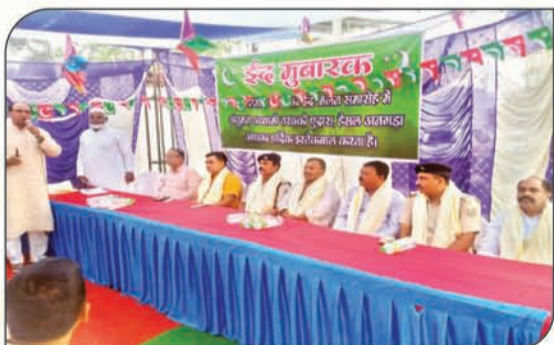
ईद मिलन के नाम पर प्रशासनिक पदाधिकारियों एवं सभी धर्म संप्रदाय को जोड़ना