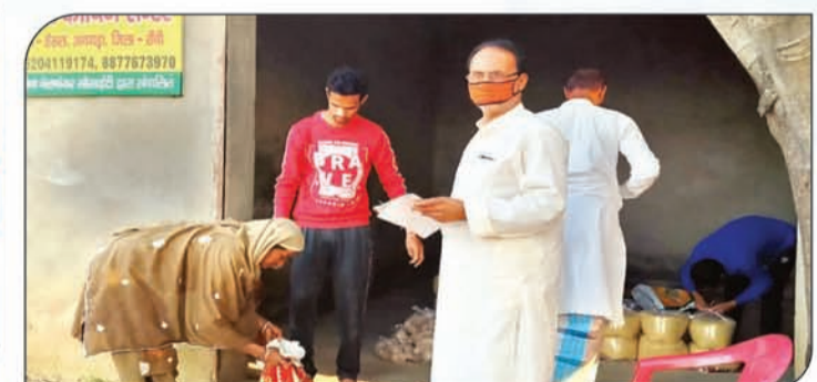
कोरोना काल में गरीबों के बीच राशन का मुफ्त वितरण