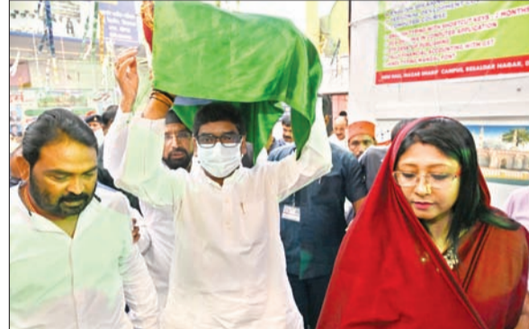
सोमवार को रांची के डोरंडा स्थित हजरतकुतुबुद्दीन रिसालदार बाबा की दरगाह पर चादरपोशी करते हुए मुख्यमंत्री हेमंत सोरेन।

बोकारो। मुख्यमंत्री हेमंत सोरेन ने कहा कि हमारी सरकार जनकल्याणकारी योजनाओं को विकास की राह में खड़े अंतिम व्यक्ति तक पहुंचाने का काम कर रही है। हम आपकी योजनाओं को लेकर आपके घर आये हैं। राज्य सरकार का उद्देश्य है कि सभी वां-समुदाय के लोगों को उनकी भावनाओं और अपेक्षाओं के अनुरूप योजनाएं उन तक पहुंचें। सरकारी पदाधिकारी आज आपके घर-द्वार पहुंच कर आपकी समस्याओं का निदान कर रहे हैं। शत प्रतिशत आवेदनों का निपटारा होगा यह पदाधिकारियों को निर्देशित किया जा चुका है। मुख्यमंत्री सोमवार को बोकारो में 'आपकी योजना-आपकी सरकार-आपके