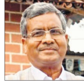
लोगों ने प्रयास करना शुरू किया, तब कार्यकर्ताओं को यह निर्देशित भी किया गया था कि वे अपने स्तर से चाहे वह पंचायत समिति हो या मुखिया का पद हो, यह कोशिश करें कि अधिक से अधिक पार्टी के समर्थक प्रत्याशी चुनाव जीतें। भाजपा की पूंजी कार्यकर्ता ही हैं। सभी कार्यकर्ताओं ने अपने-अपने

भाजपा विधायक दल के नेता बाबूलाल मरांडी का कहना है कि जब पंचायत चुनाव हो रहा था, तो लक्ष्य बिल्कुल साफ था कि इस चुनाव में पार्टी का अधिक से अधिक कार्यकर्ता या समर्थक चुनाव जीते। चूंकि यह दलगत चुनाव तो हो नहीं रहा था, फिर भी हमारा यही प्रयास था कि पार्टी के कार्यकर्ता या समर्थक अधिक से अधिक चुनावी प्रक्रिया में हिस्सा लें। त्रिस्तरीय पंचायत प्रतिनिधि चुनाव में हम लोगों ने पार्टी की तरफ से एक रणनीति बनायी कि सर्वसम्मति से प्रतिनिधि का चयन हो जाये। उसके बाद कार्यकर्ताओं को निर्देशित किया गया कि उन प्रतिनिधियों को वे जिताने का प्रयास करें। जब हम