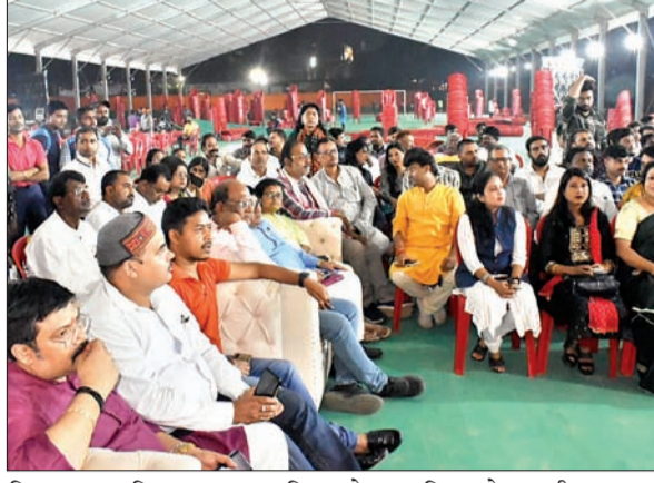
दिखना चाहिए। कहा कि जनप्रतिनिधि हमारे अतिथि भी हैं और पार्टी की पूंजी भी हैं। संगठन महामंत्री कर्मवीर सिंह ने कहा कि सम्मेलन की सफलता व्यवस्था में लगे एक-एक कार्यकर्ता के ऊपर निर्भर है। उन्होंने कहा कि सभी अपने-

का विश्वास प्राप्त किया है, वे रांची आ रहे हैं। उन्होंने भाजपा की विचारधारा को अपनी सक्रियता से जमीनी स्तर पर पहुंचाया है। जनप्रतिनिधि हमारे अतिथि भी हैं और पार्टी की पूंजी भी : बाबूलाल मरांडी वहीं भाजपा विधायक दल के लेटर और पूर्व मुख्यमंत्री बाबूलाल मरांडी ने कहा कि सम्मान समारोह में लगे सभी कार्यकर्ताओं की जिम्मेवारी है कि कार्यक्रम में आये सभी प्रतिनिधियों का केवल कार्यक्रम स्थल पर ही सम्मान नहीं हो, बल्कि उन्हें हर विभाग की व्यवस्था में सम्मान