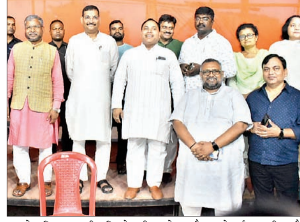
अपने विभाग की जिम्मेवारी संभाल लें, तो पूरी व्यवस्था संभल जायेगी। उन्होंने कहा कि भाजपा कार्यकर्ता जिस जिम्मेवारी को लेता है, उसे ईमानदारी और कर्मठता से पूरा करता है। यही हमारी पहचान भी है और ताकत भी। बैठक का संचालन प्रदेश