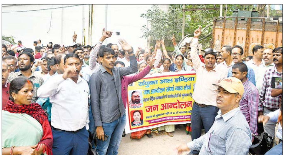
गुरुस्सा में सैकड़ों की संख्या में पीड़ित पहुंचे थाना, विरोध में की नारेबाजी