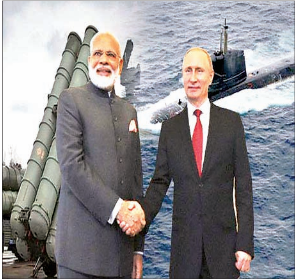
और लद्दाख को भारत का अर्धिन हिस्सा बताया है। इस नक्शे को रूस ने शंघाई सहयोग संगठन के सदस्य देशों के बीच जारी किया है। खास बात यह है कि भारत एवं चीन भी एएससीओ के सदस्य हैं। जाहिर है इन देशों की परवाह किये बगैर रूस ने नक्शा जारी किया है। माना जा रहा है कि रूस के इस कदम से एएससीओ में भारत की स्थिति मजबूत हुई है।

आजाद सिपाही संवाददाता नयी दिल्ली। भारत-पाक की दोस्ती दुनिया के कई देशों को खटकती है। दोनों ही देशों ने कई मौके पर बगैर तीसरे की परवाह करते हुए एक-दूसरे का समर्थन करते रहे हैं। रूस ने भारत समर्थन में अब जो कदम उठाया है। उसपर हर भारतीय गर्व करेगा। ऐसे मौके पर जब चीन एवं पाकिस्तान आतंकवाद के मुद्दे पर संयुक्त राष्ट्र संघ में एक-दूसरे का समर्थन कर रहे हैं तब रूस ने एक नक्शा जारी कर दोनों की चोलती बंद कर दी है। नक्शे में पाकिस्तान के कब्जे वाले कश्मीर (पीओके) और अक्सई चीन के साथ अरुणाचल प्रदेश को भारत का हिस्सा बताया गया है। इसके साथ जम्मू-कश्मीर