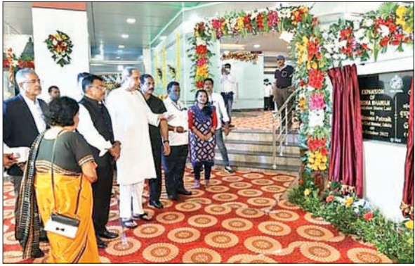
रूप से कमजोर वर्ग सरकार द्वारा रियायती दर पर प्रदान की जाने वाली इस आवास सुविधा से विशेष रूप से लाभान्वित हो रहे हैं। हालांकि मुंबई ओड़िशा भवन में मरीजों के लिए अधिक कमरों की व्यवस्था करने के लिए मुंबई में स्थित विभिन्न ओड़िशा संगठन और ओड़िशा के लोगों की ओर से लंबे समय से मांग कर रहे थे। मुख्यमंत्री ने उनकी मांगों का सम्मान करते हुए बुधवार को इस

आजाद सिपाही संवाददाता भुवनेश्वर। मुख्यमंत्री नवीन पटनायक ने बुधवार को मुंबई स्थित ओड़िशा भवन के संसारण की लिए भीति प्रस्तर स्थापना किये। गौरतलब है कि ओड़िशा भवन मुंबई जैसे मेट्रो शहरों में सरकारी अधिकारियों और विभिन्न उद्देश्यों के लिए मुंबई आने वाले साधारण लोगों को किफायती आवास प्रदान करने के लिए काम कर रहा है। इस इमारत में 28 एसी कमरे और 4 एसी डॉरमेट्री हैं। इन 16 कमरों में से 2-बेड वाले एसी कमरे और 2 एसी डॉरमेट्री मुंबई में कैंसर जैसी बीमारियों के इलाज के लिए आने वाले उड़िया लोगों के लिए हैं। ओड़िशा के आर्थिक