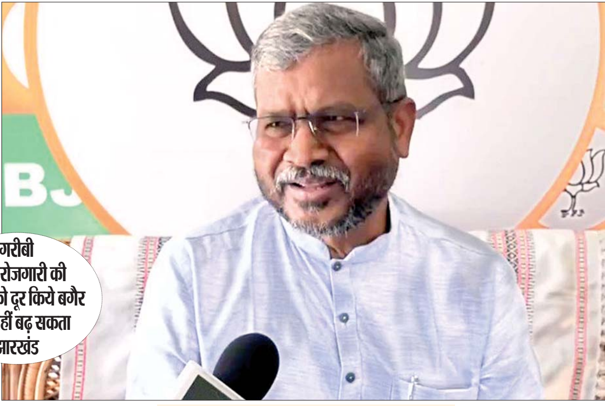
गरीबी और बेरोजगारी की समस्या को दूर किये बगैर आगे नहीं बढ़ सकता झारखंड

सवाल : भाजपा हेमंत सोरेन की सरकार को काम करने क्यों नहीं