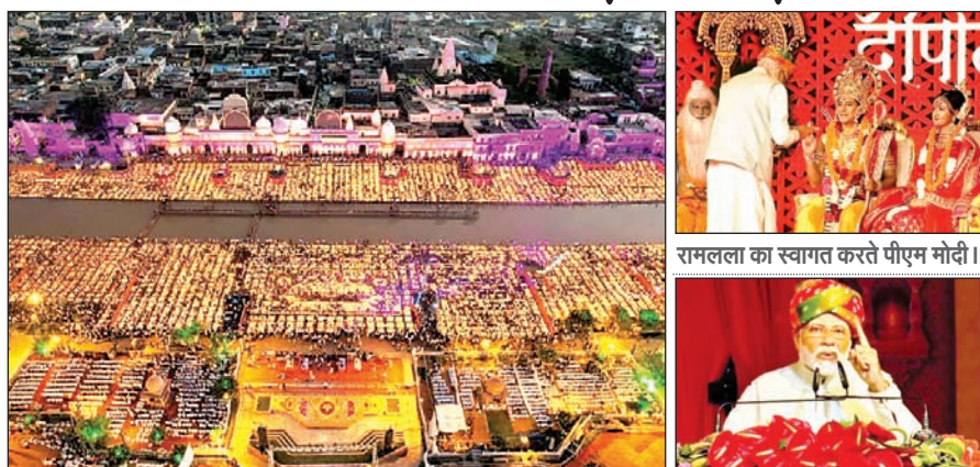
अयोध्या में दीपोत्सव : 15 लाख दीयों से सरयू के तट जगमगा उठे हैं।