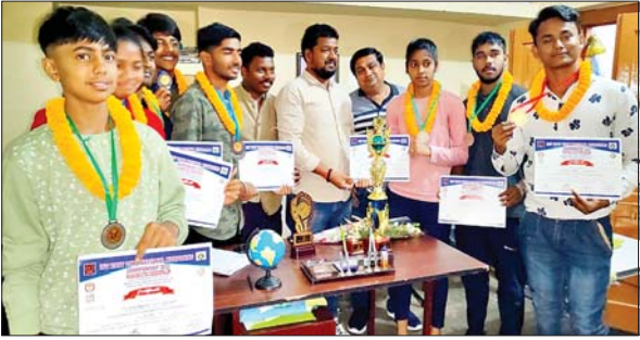
पदक जीतने वाले खिलाड़ियों का किया गया सम्मान।