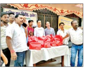
जरूरतमंदों में कपड़े-मिठाई बांटे लो।

झरिया। पर्व त्योहारों में हमसभी अपने के लिए खुशियां खरीदते हैं, लेकिन समाज में बहुत सारे ऐसे जरूरतमंद हैं जो अपने घर-परिवार और बच्चों की खुशियां नहीं खरीद पाते। ऐसे लोगों के चेहरे पर छोटी सी मदद मुस्कान बिखेरने के इरादे से हम सभी को अपने आसपास के जरूरतमंदों की मदद करना चाहिए। उक्त बातें झरिया यूथ ब्रिगेड के सदस्यों ने कही। वे रविवार को दीपावली पर जरूरतमंदों के बीच दीया, तेल, बत्ती, पटाखे और मिठाई का वितरण कर रहे थे। कार्यक्रम के शुभारंभ श्री श्याम मौरि ग्राउंड से किया गया और पूरे शहर में भ्रमण कर जरूरतमंद लोगों के बीच