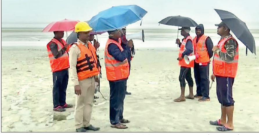
पश्चिम बंगाल के दक्षिण 24 परगना के बक्खाली बीच पर साइक्लोन को लेकर एनडीआरएफ की टीम तैनात की गयी है।

नयी दिल्ली। बांग्लादेश के तटीय क्षेत्र से टकराने के बाद साइक्लोन सितरंग ने भारत में दस्तक दे दी है। मौसम विभाग (आइएमडी) ने असम, मेघालय, मिजोरम और त्रिपुरा में रेड अलर्ट जारी किया है। रेड अलर्ट का मतलब है इन राज्यों में भारी से बहुत भारी बारिश होने की संभावना है। आइएमडी के मुताबिक साइक्लोन सितरंग की भारत में पंटी हो गयी है। छह राज्यों में तेज हवाएं, तीन में बारिश