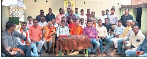
संवाददाता सम्मेलन कर नाराजगी जाहिर करते ब्राह्मण समाज के लोग।