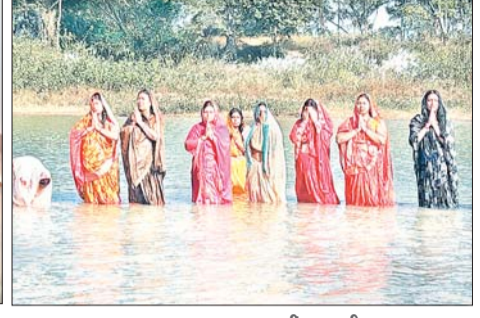
खरना का पूजन करती व्रती महिलाएं। खरना पर तालाब में स्नान कर भगवान भास्कर का पूजन करती छठव्रती।