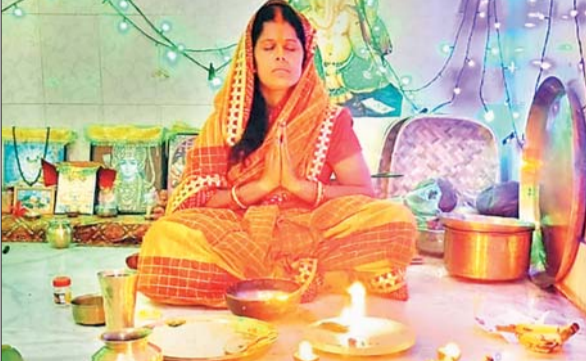
खरना पूजन करती छठब्रति महिला।

धनबाद। लोक आस्था के महापर्व छठ के दूसरे दिन शनिवार को कोयलांचल धनबाद में खरना पूजन के साथ प्रतियों ने 36 घंटे का निर्जला उपवास शुरू किया। धनबाद के निरसा, चिरकुंडा, गोविंदपुर, बरवड्डा, राजगंज, तेलुमारी, धनबाद, बलियापुर, सिंदरी, झरिया, डिगवाडीह, सिंदरी, कतरास, पुटकी, लोयाबाद, केदुआ, बाघमारा और धनसार सहित अन्य सभी क्षेत्रों में इस दिन सुबह खरना को लेकर विशेष तैयारियां चलती रही। महिलाएं खीर-प्रसाद बनाने के दौरान छठी मां के गीत गाती रही। संंध्या में प्राचीन नियमानुसार तरीके से प्रसाद के रूप में खीर,पूड़ी