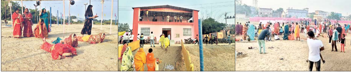
आजाद सिपाही संवाददाता

गढ़वा। छठ महापर्व के पावन अवसर पर जिला मुख्यालय में विभिन्न छठ घाटों पर छठ व्रतियों ने जाकर स्नान कर पान पत्ता और कसईली अपनी थाली पर रखकर छठी मैया को आममन के लिए न्योता दिया।