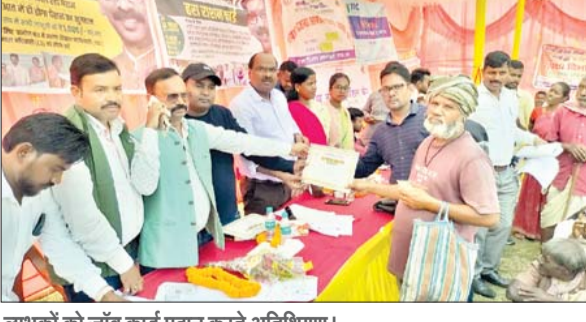
लाभुकों को जाँच कार्ड प्रदान करते अतिथिगण।