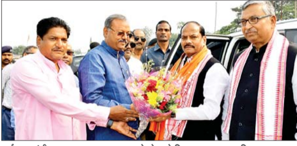
पूर्व मुख्यमंत्री रघुवर दास का स्वागत करते बोकारो विधायक व भाजपा जिलाध्यक्ष।

बोकारो। भाजपा के राष्ट्रीय उपाध्यक्ष सह झारखंड के पूर्व मुख्यमंत्री रघुवर दास का पार्टी कार्यकर्ताओं ने बियाडा हाऊसिंग कॉलोनी के पास भव्य स्वागत किया। इसकी अगुवाई बोकारो विधायक बिरंची नारायण और जिलाध्यक्ष भरत यादव ने की। अपने संबोधन में रघुवर दास ने कहा कि जब मुख्यमंत्री हेमंत सोरेन ने कोई गलत काम नहीं किया है, तो उन्हें डर किस बात का है। एक तरफ वो संवैधानिक संस्था इडी को सार्वजनिक रूप से धमकी दे रहे हैं, तो दूसरी तरफ वो उसी संस्था से तीन सप्ताह का समय भी मांग रहे हैं। उन्होंने कहा कि जब-जब भ्रष्टाचार में लिप्त ऐसे नेताओं पर कानून का शिकंजा कसता है, तब वो संवैधानिक संस्थाओं को धमकाने का काम करते हैं। लेकिन मुख्यमंत्री हेमंत सोरेन भूल रहे हैं कि हमारे देश में लोकतंत्र है, राजतंत्र नहीं। कानून