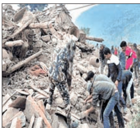
अनुसार, नेपाल में भूकंप 9

एजेंसी नयी दिल्ली। पड़ोसी देश नेपाल में मंगलवार देर रात 6.3 तीव्रता का भूकंप आया। झटके भारत के दिल्ली, यूपी समेत उत्तर भारत के 5 राज्यों में भी महसूस किये गये। लोग दहशत में घरो से बाहर निकल आये। नेशनल सेंटर फॉर सीस्मोलॉजी के