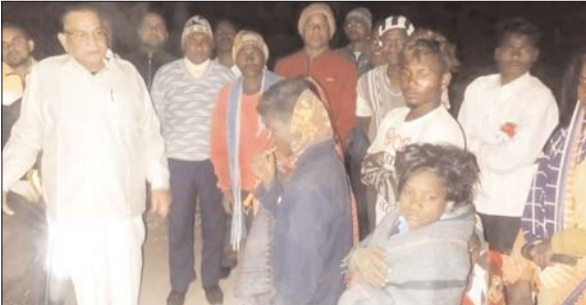
बिरहोर लोगों से बातें कर उनकी समस्याएं सुनते पूर्व मंत्री माधव लाल सिंह।

गोमिया । प्रखंड केअति उग्रवाद प्रभावित क्षेत्र बडकी सिधावारा पंचायत के बिरहोरटांड गांव में पिछले 20 दिनों से बिजली गुल है। इससे लोगों को काफी परेशानी हो रही है। इसकी सूचना पर ग्रामीणों से मिलने और उनकी व्यथा सुनने मंगलवार को राज्य के पूर्व मंत्री माधव लाल सिंह बिरहोरटांड गांव पहुंचे थे। उन्होंने लोगों के बीच मिटाई और बिस्कुट भी बांटा। इस दौरान चतरोचट्टी सिधावारा के बिरहोर परिवार के लोगों ने पूर्व मंत्री से कहा कि पूरे गांव में पिछले 20 दिनों से बिजली नहीं है। बार-बार शिकायत दर्ज कराने के बावजूद बिजली आपूर्ति शुरू नहीं की गई है। ग्रामीण अंधेरे में जीवन यापन करने को मजबूर हैं। वहीं, जनवितरण प्रणाली द्वारा संचालित टुकानदारों पर भी कम अनाज देने की बात कही। कहा कि 35 किलो अनाज नहीं मिलता