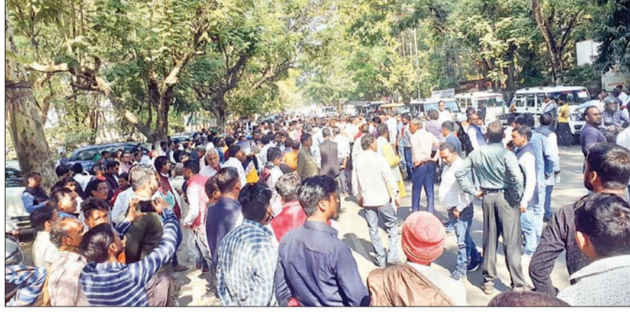
मुख्यमंत्री हेमंत सोरेन के समर्थन में मोरहाबादी मैदान में जुटे जेएमएम समर्थक।