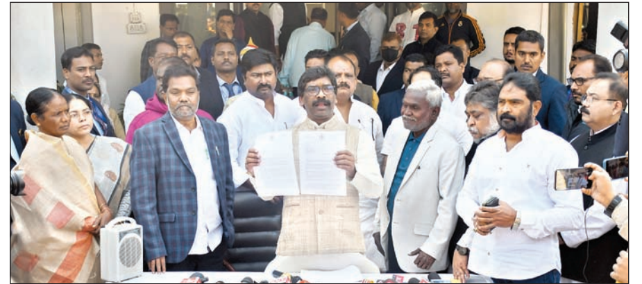
इडी कार्यालय रवाना होने से पहले अपने आवास में मीडिया से बात करते मुख्यमंत्री हेमंत सोरेन।

रांची। मुख्यमंत्री हेमंत सोरेन गुरुवार को इडी कार्यालय रवाना होने से पहले अपने आवास में मीडिया से बातचीत में केंद्र और राज्यपाल पर खूब बरसे। उन्होंने राज्यपाल की भूमिका पर प्रश्न उठाया। उन्होंने कहा कि राज्यपाल झारखंड में बम फोड़ने की बात करते हैं। फिर इडी की कार्रवाई सत्ता पक्ष के नेताओं के ऊपर शुरू हो जाती है। इसमें कहीं ना कहीं राज्यपाल की भूमिका संदेह के घेरे में है। वह राजनीतिक दल के कार्यकर्ता की तरह व्यवहार कर रहे हैं। मुख्यमंत्री ने इडी के अधिकारियों से कहा कि बगैर तथ्यों एवं आंकड़ों का सत्यापन किये एक हजार करोड़ के अवैध खनन से संबंधित सनसनीखेज आरोप एक संवैधानिक पद पर बैठे व्यक्ति पर लगाना इडी को शोभा नहीं देता है। सीएम ने कहा कि वर्तमान परिस्थितियों से राज्य में राजनीतिक अनिश्चितता का माहौल बन गया