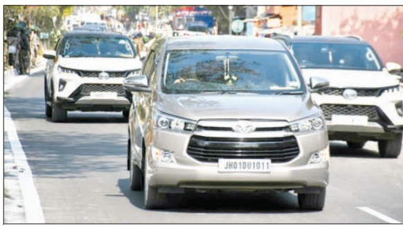
इडी कार्यालय जते मुख्यमंत्री हेमंत सोरेन।

मुख्यमंत्री के इडी कार्यालय आने से पहले सुरक्षा व्यवस्था चाक-चौबंद कर दी गयी थी। दिन में करीब साढ़े 10 बजे हिन्दू चौक