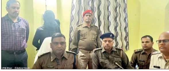
भाई की हत्या करने के आरोप में गिरफ्तार सगा भाई।