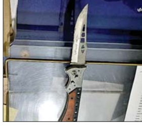
हत्या में इस्तेमाल हुआ चाकू।