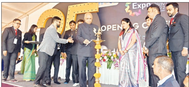
मोरहाबादी मैदान में गुरुवार को एक्सपो उत्सव का उद्घाटन करते राज्यपाल रमेश बैस।

राज्यपाल ने कहा कि यह बहुत अच्छी बात है कि रांची जैसे शहर में इस तरह के कार्यक्रम का आयोजन किया जा रहा है। मैं