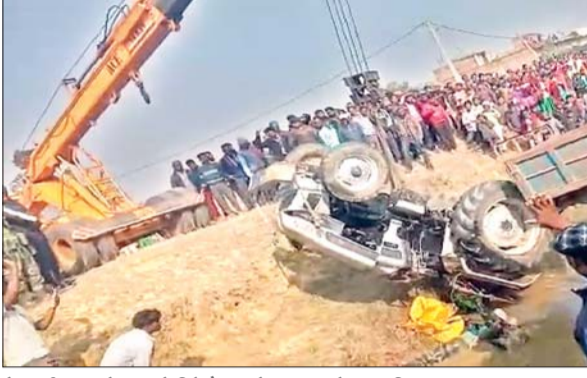
क्रेन की मदद से नगर में गिरे ट्रैक्टर के इंजन को बाहर निकाला गया।