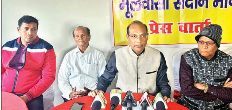
पंचायतों में पंचायत का चुनाव भी नहीं हो पाया था। उन्होंने बताया कि रांची जिला में अनुसूचित

शैक्षणिक स्थिति का सर्वेक्षण व वह जनगणना करवाया जाये। जिससे ओबीसी के साथ सदान समुदाय के सर्वगों को भी आरक्षण का लाभ मिल सके और कानूनी अडचन की बाधा को भी दूर किया जा सके। उन्होंने जोर देकर कहा कि नगर निकाय चुनाव में जब तक पिछड़ों का आरक्षण सुनिश्चित नहीं किया जाता है तब तक निकाय चुनाव नहीं कराने का आग्रह सरकार से किया। उन्होंने सदान आयोग बनाने की मांग की है, जिससे सदानों के हरेक वर्ग को लाभ मिल सके। उन्होंने कहा कि झारखंड के 12 जिलों को पांचवीं अनुसूचित क्षेत्र घोषित करना गैर संवैधानिक है। प्रसाद ने कहा कि साहिबगंज और पाकुड़ जिला के बहुत सारे पंचायतों में जनजातियों की एक भी आबादी नहीं है। जिसके कारण वैसे