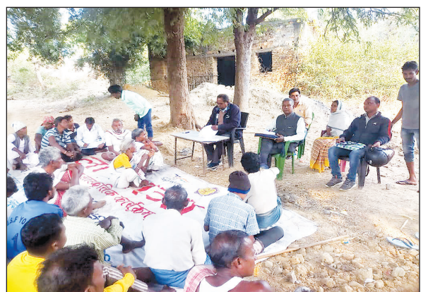
गोमियाकोचा और कुरचूडीह गांव में आयोजित ग्राम सभा में उपस्थित लोग। लाल कार्ड होते हुए भी राशन डीलर नहीं देता है राशन।

तमाड़ (आजाद सिपाही)। तमाड़ प्रखंड का कुरचूडीह गांव अब सुखियों में है। रांची से कुछ ही दूरी पर बसा 25 मुंडा परिवारों का यह गांव आज भी मूलभूत सुविधाओं से महरूम है। इस गांव में 'आजाद सिपाही' की टीम 9 नवंबर को पहुंची थी। गांव की स्थिति और लोगों की परेशानियों के बारे में 'आजाद सिपाही' ने प्रमुखता से छापा था। इसका असर यह हुआ कि अब प्रशासन गांव की सुध लेने लगा है। सोमवार को प्रशासनिक अधिकारी गांव पहुंचे। लोगों का पेंशन योजना के तहत आवेदन लिया गया, तो प्रधानमंत्री