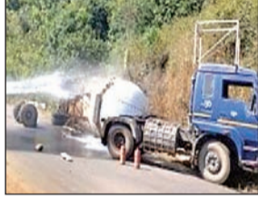
घटना के संबंध में अग्निशमन विभाग ने सूचित किया। पुलिस और तहसीलदार के साथ पटनाई और सेमिलीगुड़ा दमकल विभाग मौके पर मौजूद है।

आजाद सिपाही संवाददाता भुवनेश्वर। कोरापुट-आंध्र को जोड़ने वाले राष्ट्रीय राजमार्ग पर गैस टैंकर पलट गया। उसके टैंक से गैस लीक हो रही है। खबरों के मुताबिक मंगलवार सुबह पटनाई प्रखंड के रालेगडा के पास राजगुड़ा में गैस टैंकर पलट गया, जिससे टंकी से गैस का लगातार रिसाव हो रहा है। इसलिए अगले दो दिनों तक राष्ट्रीय राजमार्ग बंद रहेगा।