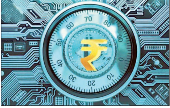
पटना और शिमला जैसे शहरों में डिजिटल रुपये का चलन शुरू होगा।

आजाद सिपाही संवाददाता नयी दिल्ली। शोक डिजिटल रुपये के बाद आरबीआइ एक दिसंबर से खुदरा डिजिटल रुपये का चलन शुरू करने जा रहा है। खुदरा डिजिटल रुपये से ग्राहक आपस में लेनदेन के साथ किसी भी दुकान से खरीदारी भी कर सकेंगे। खुदरा डिजिटल रुपये का चलन अभी देश के चार शहरों से पायलट रूप में शुरू किया जा रहा है। इन शहरों में मुंबई, दिल्ली, बंगलुरु और भुवनेश्वर शामिल हैं। इसके बाद अहमदाबाद, गंगटोक, गुवाहाटी, हैदराबाद, इंदौर, कोच्चि, लखनऊ,