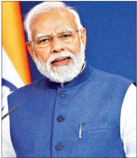
श्री नरेंद्र मोदी प्रधानमंत्री

किया है, मैं अपने आपसे यह पूछता हूँ- क्या जी-20 अभी भी और आगे बढ़ सकता है? क्या हम समग्र मानवता के कल्याण के लिए मानसिकता में मूलभूत बदलाव को उत्प्रेरित कर सकते हैं?