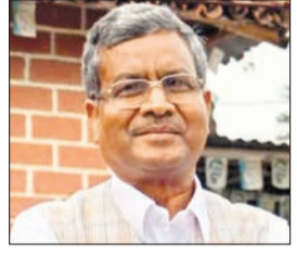
बाबूलाल मरांडी पूर्व मुख्यमंत्री, झारखंड

अपने मुख्यमंत्रित्व काल का एक अनुभव शेयर कर रहा हूँ। उग्रवादियों का उत्पात चरम पर था। मेरी योजना ज्यादा से ज्यादा उग्रवादियों और उनके सहयोगियों को मुख्यधारा में वापस लाने की थी। आदिवासी बाहुल्य एक जिले में कुछ उग्रवादियों को लॉजिस्टिक सपोर्ट देने वालों के पीछे पुलिस हाथ धोकर पड़ी हुई थी। मैंने वहाँ के एक सीनियर पदाधिकारी को बुलाकर कर कहा कि उन्हें मुख्यधारा में लाना चाहता हूँ। थोड़ा रहम करिये उन पर। वो अधिकारी रो पड़े। उन्होंने कहा कि ‘सर ये लोग भारी बदमाश हैं। मेरे से तो ये नहीं होगा। आप चाहें तो मुझे वहाँ से हटा दीजिये।’ मैंने तुरंत अपनी बात वापस ली और उन्हें कहा कि बेहिकर अपनी कार्रवाई जारी रखिये।