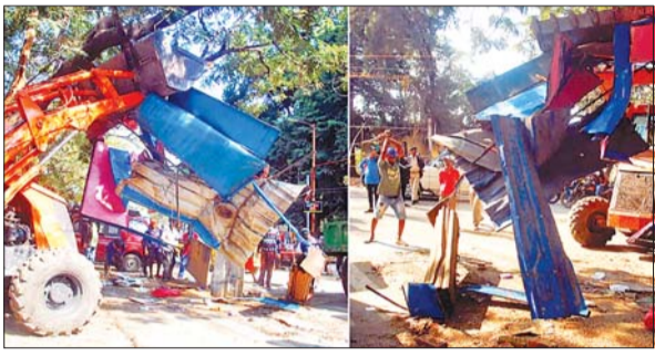
अतिक्रमण हटाते निगम के बुलडोजर।

धनबाद। नगर निगम का अतिक्रमण हटाओ अभियान बुधवार को दूसरे दिन भी जारी रहा। इस दौरान बेकारबांध से पॉलीटेनिक रोड तक सड़क के दोनों ओर अतिक्रमणकारियों पर शिकंजा कसा। स्थायी तौर पर बना ली गई आधा दर्जन लोहे की गुमटियां जब्त की गईं। उधर, अतिक्रमण हटाओ अभियान का फुटपाथ दुकानदारों ने जोरदार विरोध भी किया। इसमें एक नई बुलडोजर पर दुकानदारों ने हमला कर दिया। डंडे मारकर शीशा तोड़ दिया। इस मामले में नगर निगम