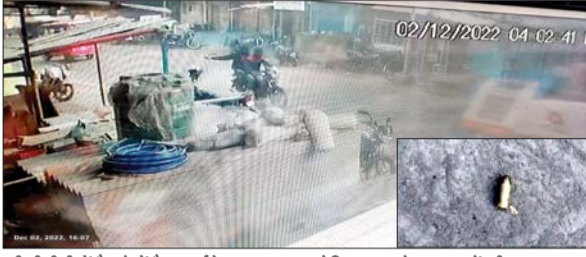
सीसीटीवी में कैमरे में कैद हाईवेवर दुकान पर गोलियां चलाते हमलावरों की करतूत

कतरास थाने से कुछ दूरी पर ही दिया गया घटना को अंजाम आजाद सिपाही संवाददाता