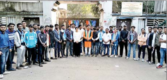
शांत किया। आश्वासन दिया कि आपका साल बर्बाद नहीं होगा, तब जाकर एनएसयूआई नेता रोड से हटे। ज्ञात हो कि सीए सेमेस्टर फोर एग्जाम का सेंटर एसएसएलएनटी महिला कॉलेज में