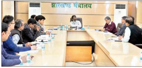
झारखंड बिजली वितरण निगम लिमिटेड की समीक्षा करते मुख्यमंत्री हेमंत सोरेन।

रांची। मुख्यमंत्री हेमंत सोरेन ने कहा है कि राज्य में बिजली कटौती पर हर हाल में रोक लगायी जाए। बिजली कटौती को रोकने के लिए हर जरूरी उपाय करें। राज्य की जनता को निर्बाध बिजली उपलब्ध कराना सरकार की प्राथमिकता है। मुख्यमंत्री ने अधिकारियों से कहा कि पिछले कुछ हफ्तों से बिजली कटने की शिकायतें मिल रही हैं। झारखंड बिजली वितरण निगम लिमिटेड (जेबीवीएनएल) राज्य में ऊर्जा क्षेत्र की एक महत्वपूर्ण इकाई है। इसके जरिए ही पूरे राज्य में बिजली आपूर्ति की जाती है। झारखंड बिजली वितरण निगम लिमिटेड (जेबीवीएनएल) राज्य में ऊर्जा क्षेत्र की एक महत्वपूर्ण इकाई है। इसके जरिए ही पूरे राज्य में बिजली आपूर्ति की जाती है। झारखंड बिजली वितरण निगम लिमिटेड (जेबीवीएनएल) राज्य में ऊर्जा क्षेत्र की एक महत्वपूर्ण इकाई है। इसके जरिए ही पूरे राज्य में बिजली आपूर्ति की जाती है।