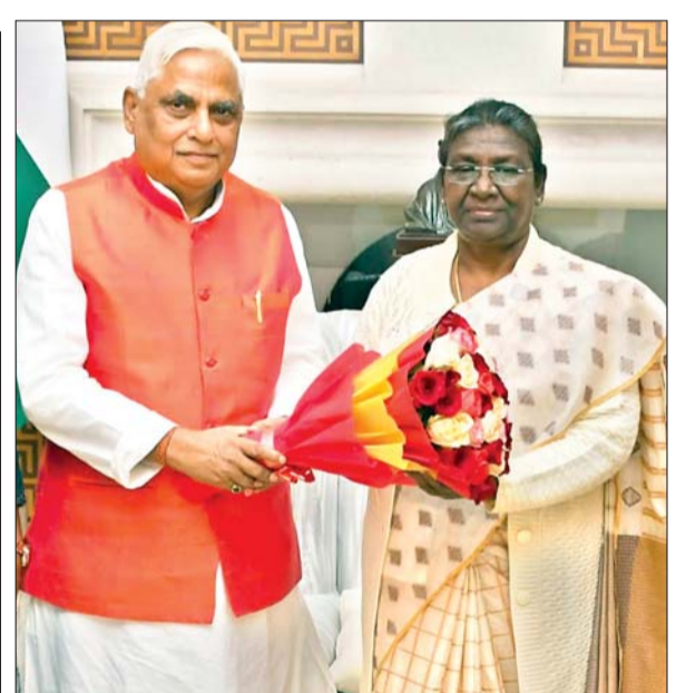
मंगलवार को जयनंद ने नयी दिल्ली में राष्ट्रपति भवन में राष्ट्रपति द्रौपदी मुर्मू से शिष्टाचार मुलाकात की।