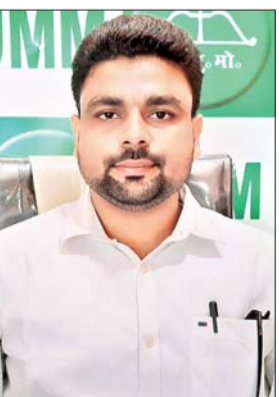
साथ ही जमीन रजिस्ट्री के बाद

म्यूटेशन की प्रक्रिया स्वतः प्रारंभ हो जाना राज्य की जनता के लिए बहुत ही सराहनीय कदम है।