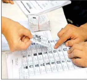
से मतदाता पुनरीक्षण की जानकारी ली। उनके कहा कि अधिक से

अधिक योग्य मतदाताओं का नाम सूची में शामिल करें। डीसी ने कहा कि पहली जनवरी 2023 को 18 साल पूरा कर लेने वाले सभी के नाम मतदाता सूची में शामिल करना है। यह प्रयास रहे कि किसी भी योग्य व्यक्ति का नाम छूटने ना जाए। मतदाता सूची में नाम, पता, पिता या पति के नाम में गलती में भी सुधार करवाया जा सकता है। मतदाताओं के नाम एक बूथ से दूसरे बूथ में ले जाने के लिए भी आवेदन दिए जा सकते हैं। डीसी ने कहा कि जिले से बाहर चले गए या फिर मौत के शिकार लोगों के नाम मतदाता सूची से हटाए जा सकते हैं। इसके अलावा डीसी हिरापुर लिंडसे क्लब और धनबाद क्लब बूथ में भी गए और निरीक्षण किया।