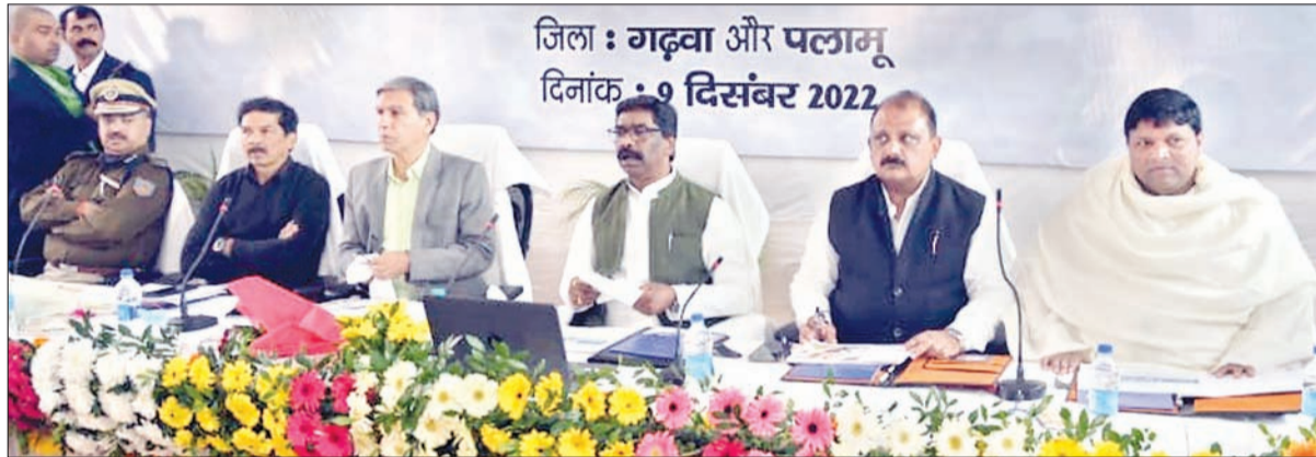
जिला : गढ़वा और पलामू दिनांक : 9 दिसंबर 2022

● बालू और पत्थर के अवैध उत्खनन को सक्रियता से रोकने का निर्देश दिया