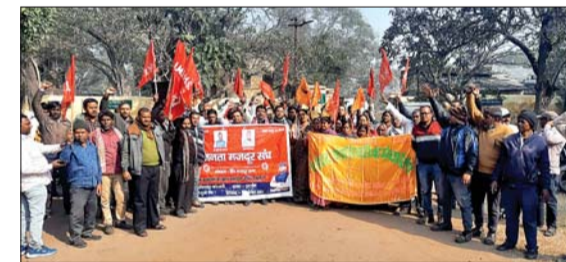
एचएमएस, एआईटीयूसी, सीटू द्वारा बैठक कर सर्वसम्मति से बीसीसीएल के सभी इकाइयों में विरोध प्रदर्शन करने का निर्णय लिया था। जिसे लेकर आज स्थायी एवं ठेका श्रमिक ने अपनी चहुनी एकता का परिचय देते हुए विरोध प्रदर्शन को सफल बनाया। मोर्चा नेताओं ने चेतावनी दी कि आंदोलन के बावजूद कोल प्रबंधन की कुंभकर्णी नौद नहीं खुली तो आंदोलन की अगली कड़ी में सात जनवरी 2023 को रांची में संयुक्त मोर्चा के कनवेंशन में, कोल इंडिया प्रबंधन की दिशा और दशा तय कि जाएगी, क्योंकि कोयला श्रमिक कोरोनाकाल में मुश्किल व संकट की घड़ी में कोयले मजदूरों ने आपूर्ति कर देश को रौशन किया था। बावजूद इसके कोयला मजदूरों के वेतन बढ़ोतरी में प्रबंधन आनाकानी कर रहा है।

आजाद सिपाही संवाददाता धनबाद। पूर्व घोषित कार्यक्रम के तहत शुक्रवार को बीसीसीएल के सभी क्षेत्रीय व कोलियरी कार्यालय के सक्षम संयुक्त मोर्चा के नेताओं ने धरना व प्रदर्शन किया। उक्त आंदोलन 11वां वेतन समझौते में हो रहे विलंब को लेकर किया गया, जिसके तहत मजदूर नेताओं ने अपने-अपने क्षेत्र में प्रदर्शन, गेट मीटिंग, पुताला दहन, नारेबाजी और काला बिल्वा लगाकर प्रबंधन को चेतावनी दी। संयुक्त मोर्चा के वरिष्ठ नेताओं ने कहा कि कोल प्रबंधन द्वारा 11वां राष्ट्रीय कोयला वेतन समझौता में गैर जिम्मेदाराना एवं टालमटोल की मंशा देखते हुए जेबीसीसीआई में शामिल चारों केंद्रीय संगठन बीएमएस, एचएमएस, एआईटीयूसी, सीटू द्वारा बैठक कर सर्वसम्मति से बीसीसीएल के सभी इकाइयों में विरोध प्रदर्शन करने का निर्णय लिया था। जिसे लेकर आज स्थायी एवं ठेका श्रमिक ने अपनी चहुनी एकता का परिचय देते हुए विरोध प्रदर्शन को सफल बनाया। मोर्चा नेताओं ने चेतावनी दी कि आंदोलन के बावजूद कोल प्रबंधन की कुंभकर्णी नौद नहीं खुली तो आंदोलन की अगली कड़ी में सात जनवरी 2023 को रांची में संयुक्त मोर्चा के कनवेंशन में, कोल इंडिया प्रबंधन की दिशा और दशा तय कि जाएगी, क्योंकि कोयला श्रमिक कोरोनाकाल में मुश्किल व संकट की घड़ी में कोयले मजदूरों ने आपूर्ति कर देश को रौशन किया था। बावजूद इसके कोयला मजदूरों के वेतन बढ़ोतरी में प्रबंधन आनाकानी कर रहा है।