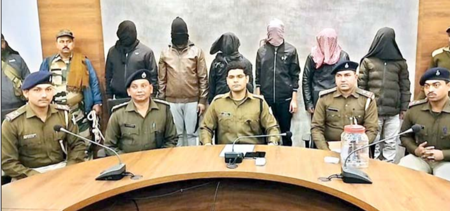
अपराधियों के पास से बरामद हुई तीन बाइक