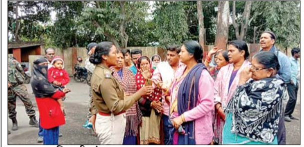
आजाद सिपाही संवाददाता

महुदा। मुआवजा और नियोजन की मांग को लेकर शनिवार को बोसीसीएल एरिया 4 के भूमि आउटसोर्सिंग उत्खनन स्थल में बैठे रैयतों के साथ पुलिस की नोकझोंक हो गई। इसके बाद पुलिस चार रैयतों को हिरासत में ले लिया, जिससे स्थिति तनावपूर्ण हो गई। मौजूदा स्थिति से निपटने के लिए मौके पर भारी संख्या में पुलिस बलों की तैनाती की गई है। बताते चले कि विगत सोमवार से बाघमारा के तेलुमारी थाना क्षेत्र स्थित बोसीसीएल एरिया-4 में संचालित भूमि आउटसोर्सिंग कंपनी में रैयत पूर्व घोषित कार्यक्रम के तहत मुआवजा और