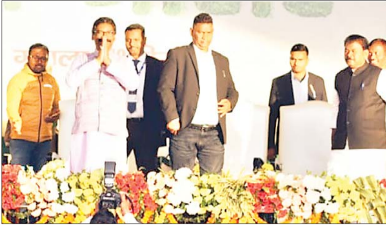
सीएम ने मंच पर चढ़ते ही लोगों को हाथ जोड़े।