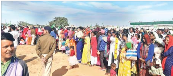
हेलोकॉप्टर देखने के लिए उमड़ी लोगों की भीड़।