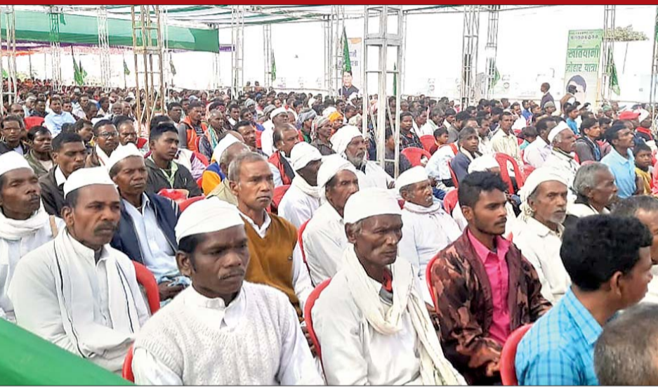
कार्यक्रम में पारंपरिक वेश भूषा में गावों के आये लोक कलाकार महिला पुरुषों की उपस्थिति भी देखी गयी। कार्यक्रम स्थल पर राज्य सरकार द्वारा चलायी जा रही योजनाओं से संबंधित पोस्टर लगाये गये थे। कार्यक्रम में भारी संख्या में टाना भक्तों की भीड़ भी देखी गई।