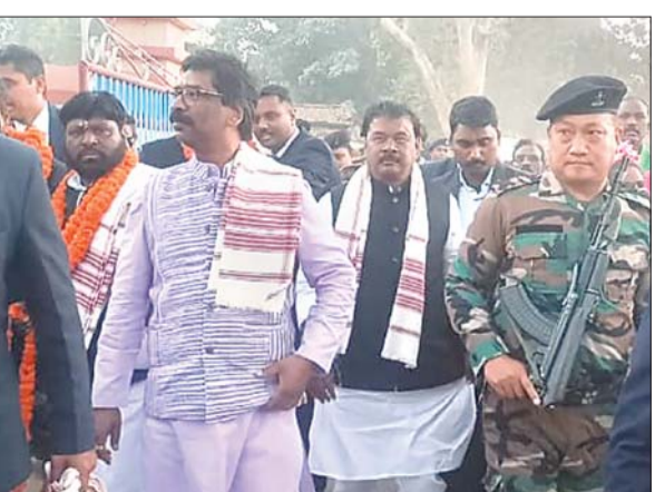
मौके पर सेंट अंजेलो छात्रावास की छात्राओं ने पारंपरिक रीति-

गुमला। आदिवासी, दलितों, पिछड़ों और अल्पसंख्यकों को बौद्धिक रूप से मजबूत होने की जरूरत है। इसका सबसे बेहतर माध्यम शिक्षा है। मुख्यमंत्री हेमंत सोरेन ने गुमला जिला भ्रमण कार्यक्रम के तहत सेंट पेट्रिक महागिरजा परिसर, गुमला में छात्राओं को संबोधित करते हुए ये बातें कही। उन्होंने छात्राओं से कहा कि आप खूब मन लगाकर पढ़ें। शिक्षा और अन्य क्षेत्रों में नई ऊंचाइयों को प्राप्त करें। इसके लिए राज्य सरकार की ओर से आपको पूरा सहयोग मिलेगा। इस