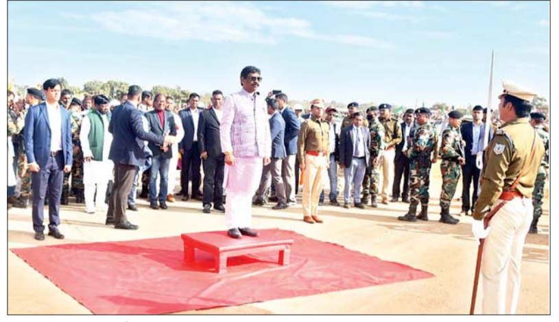
सीएम को दिया गया गार्ड ऑफ ऑनर।