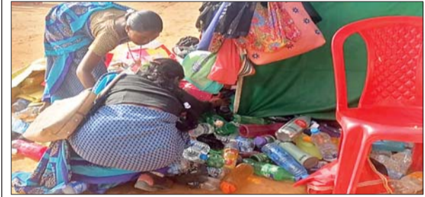
कार्यक्रम में आये लोगों को पानी का बोतल तक कार्यक्रम स्थल में नहीं लगाने दिया गया। लोगों को प्यासे ही 11 बजे सुबह से लेकर 4 बजे शाम तक कार्यक्रम स्थल में रहना पड़ा। लोग पानी के लिए काफी परेशान देखे गये।

घाघरा (आजाद सिपाही)। मुख्यमंत्री आगमन के सुरक्षा के नाम पर 1 बजे से यात्री वाहन को खड़ा किए जाने के बाद यात्रियों का सब्र का बांध जब टूटा तो जमकर काटा गया बवाल, पुलिस पदाधिकारियों के सामने आकर अपने बच्चों को गोद में लेकर बोले कि हमारे बच्चे सुबह से भूखे हैं हमें क्यों रोक दिया गया है जब मुख्यमंत्री को इतना लोट से आना था तो कम से कम 1 घंटे पहले रास्ता रोक्ना चाहिए था, लेकिन यहां पूरे 5 घंटे से अधिक सड़क के किनारे राहगीरों को रोकने से भारी परेशानियों का सामना करना पड़ा। राहगीरों को काफ़ी समझा बुझा कर मनाया गया तब जाकर बवाल काट रहे यात्री शांत हुए यात्रियों का कहना था कि कई जगह मुख्यमंत्री का कार्यक्रम हम लोगों ने देखा है लेकिन जिस तरह से घाघरा में मुख्यमंत्री आगमन को लेकर आम जनता को परेशान किया गया। इससे हेमंत सोरेन मुख्यमंत्री का छवि को धूमिल करने का प्रयास किया गया है।