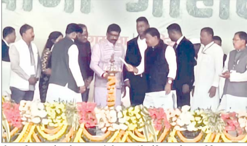
दीप प्रज्वलित कर कार्यक्रम की शुरुआत करते सीएम, श्रम मंत्री, पूर्व विधायक और अन्य अतिथिगण।