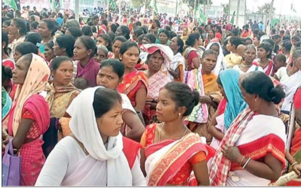
बैठक की व्यवस्था नहीं होने से नाराज दिखी दूरदराज से आयी महिलाएं।