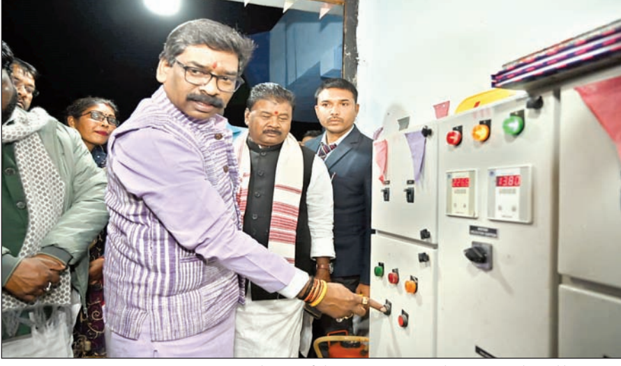
गम्हरिया, नवडीहा (पंचायत), घाघरा, गुमला में जलापूर्ति योजना का उद्घाटन करते हुए मुख्यमंत्री हेमंत सोरेन।

गम्हरिया नवडीहा (पंचायत), घाघरा, गुमला। राज्य सरकार की स्पष्ट सोच है कि हर व्यक्ति की ना सिर्फ बात सुनी जाए, बल्कि उसकी समस्याओं का भी समाधान हो। इसी कड़ी में हम जिलों का दौरा कर जनता से सीधा संवाद कर रहे हैं, ताकि उनकी परेशानियों को समझते हुए उसका निराकरण कर सके। मुख्यमंत्री हेमंत सोरेन ने सोमवार को गम्हरिया नवडीहा (पंचायत), घाघरा, गुमला में आयोजित लोक संवाद कार्यक्रम में ग्रामीणों से सीधा संवाद करते हुए ये बातें कही। मुख्यमंत्री ने कहा कि वे खुद क्षेत्र भ्रमण कर विकास कार्यों और कल्याणकारी योजनाओं की जमीनी हकीकत को समझने का प्रयास कर रहे हैं।