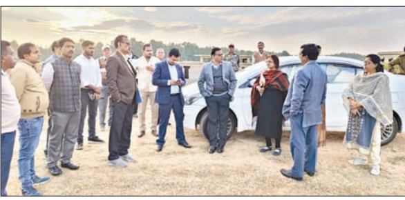
नॉलेज सिटी स्थल का निरीक्षण करते उच्च शिक्षा विभाग के सचिव व अन्य।