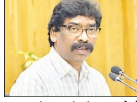
भवन) स्थित मंत्रिपरिषद कमरे में होगी। कैबिनेट की बैठक में कई अहम प्रस्ताव पर सहमति मिलने की संभावना है।

रांची (आजाद सिपाही)। आगामी बुधवार यानी 14 दिसंबर को हेमंत सोरेन सरकार की मंत्रिपरिषद (कैबिनेट) बैठक होगी। बैठक शाम चार बजे से होगी। मंत्रिमंडल सचिवालय एवं निगरानी विभाग (समन्वय) द्वारा इसे लेकर सूचना जारी की गयी है। मुख्यमंत्री हेमंत सोरेन की अध्यक्षता में यह बैठक झारखंड मंत्रालय (प्रोजेक्ट