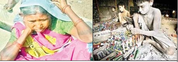
बुजुर्ग दादी को इन चारों बच्चों की सत्ता रही चिंता

मेदिनीनगर। पलामू जिला अंतर्गत पाटन प्रखंड के महुलिया गांव के चार अनाथ बच्चों की कहानी हृदयविदारक है। दो अनाथ बहनें जहां पढ़ाई छोड़ जीविकोपार्जन के लिए धनकटनी करने बिहार गयीं, वहीं दो भाई पेट की आग बुझाने के लिए मवेशी चराने और मजदूरी करने को विवश है। इन चारों बच्चों की सुध लेने की फुर्सत प्रशासनिक अधिकारियों के पास नहीं है। चाइल्डलाइन ने इसकी रिपोर्ट बीडीओ को सौंपी है। इसके बावजूद इन बच्चों की