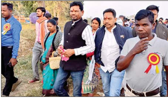
पेशार में कार्यकर्ताओं के साथ जनसंपर्क अभियान चलाने का फाइल फोटो।