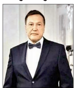
ओड़िशा क्राइम ब्रांच सहयोग करेगी।