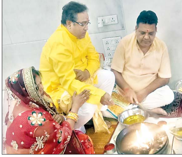
श्री आराधना में लीन थे। बजरंग बली की जय जयकारों से पूरा