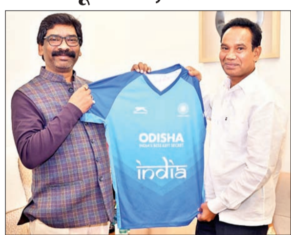
बुधवार को मुख्यमंत्री हेमंत सोरेन से कांके रोड रांची स्थित मुख्यमंत्री आवासीय कार्यालय में ओड़िशा के अनुसूचित जनजाति एवं अनुसूचित जाति विकास, अल्पसंख्यक एवं पिछड़ा वर्ग कल्याण विभाग तथा कानून मंत्री जगन्नाथ सारका ने मुलाकात की। इस मौके पर उन्होंने डॉकी विश्वकप (पुरष्) 2023 के शुभारंभ अवसर पर सम्मिलित होने के लिए मुख्यमंत्री हेमंत सोरेन को ओड़िशा आने का निमंत्रण दिया।

सुरक्षा पर अमित शाह की हाई लेवल मीटिंग नयी दिल्ली (आजाद सिपाही)। गृह मंत्री अमित शाह ने बुधवार को लेह-लद्दाख और जम्मू-कश्मीर की सुरक्षा और विकास के मुद्दे पर दिल्ली में हाई लेवल मीटिंग की है। इसमें गृह सचिव, एनआइए, सीआरपीएफ-बीएसएफ के अधिकारी और एलजी मनोज सिन्हा मौजूद रहे। यह मीटिंग जम्मू के सिधरा में सुरक्षाबलों और आतंकियों के बीच मुठभेड़ के बाद बुलायी गयी है। इसमें 4 आतंकी मारे गये थे। इसके बाद ही, गृह मंत्रालय अलर्ट हो गया।