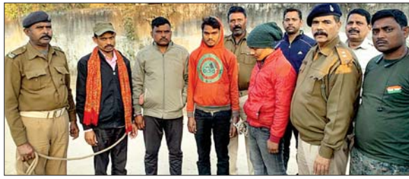
आरोपितों को गिरफ्तार कर ले जाती पुलिस।