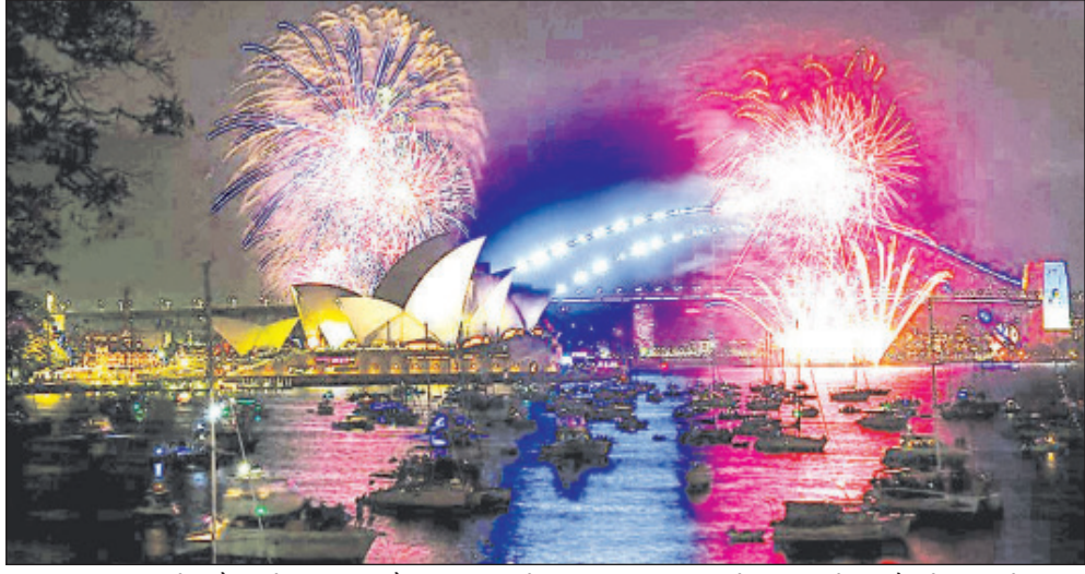
अलग-अलग समय पर न्यू ईयर मनाते हैं। समोआ, टोंगा और किरिबाती देशों में सबसे पहले नया साल होता है। इसके बाद न्यूजीलैंड में नया साल मनाया जाता है। इसके बाद आस्ट्रेलिया, जापान और