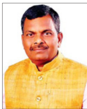
गोमिया डॉ विधायक लंबोदर महतो।

बेरमो। गोमिया विधायक डॉ लंबोदर महतो ने क्षेत्र की जनता को नए साल की बधाई एवं शुभकामनाएं दी है। कहा कि नया साल क्षेत्र की जनता का होगा। हमारा प्रयास रहेगा कि वर्ष 2022 में जो कार्य व योजना अधूरी रह गई है, उसे वर्ष 2023 में पूरा कर सकूँ। ज्यादा से ज्यादा योजनाओं का लाभ लोगों को मिले, इसके लिए निरंतर प्रयासरत भी रहूंगा। उन्होंने कहा कि कई चुनौतियों को पार पाया है और कई चुनौतियां सामने खड़ी हैं। इन चुनौतियों को भी क्षेत्र की जनता के मिले सबल से पूरा करने का भरपूर प्रयास करूंगा। हमें यकीन है कि क्षेत्र के लोगों का प्यार और आशीर्वाद मिलता रहेगा और दोगुना