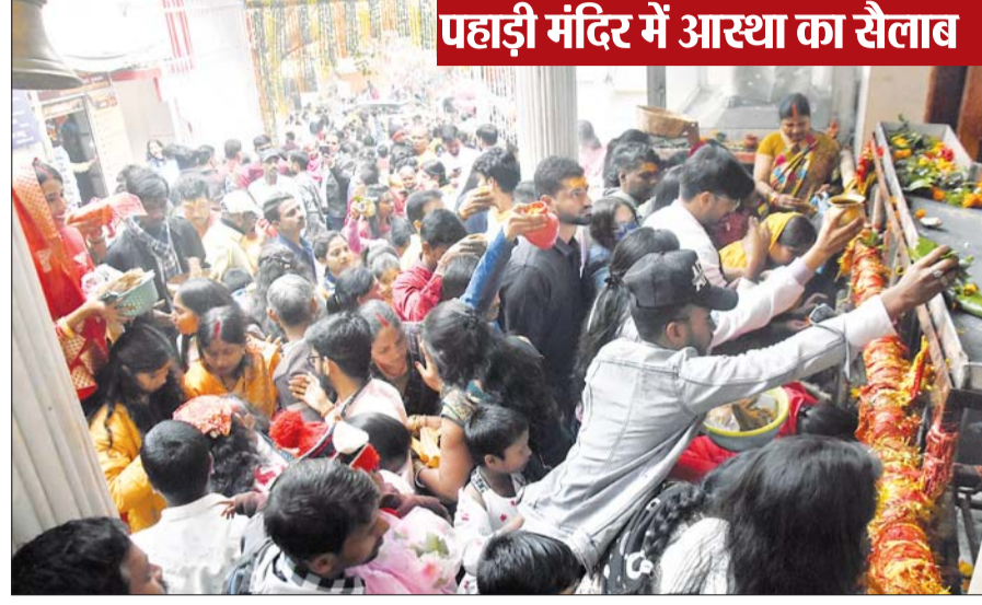
पहाड़ी मंदिर में आस्था का सैलाब

शहर और शहर से सटे इलाके में सुरक्षा के पख्ता इंतजाम थे