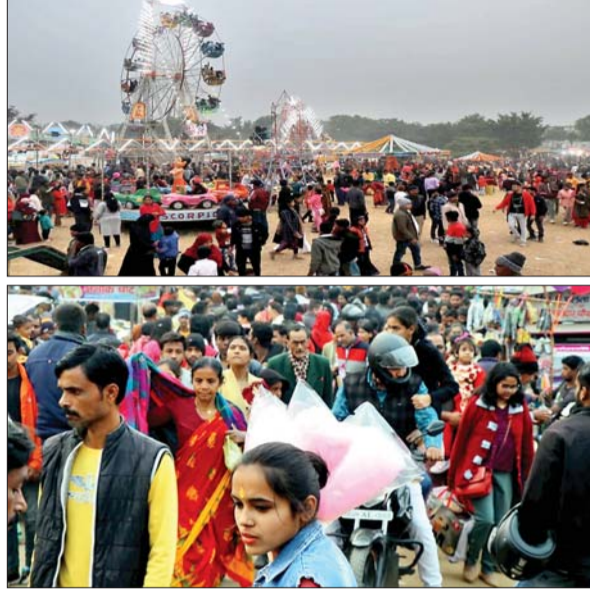
अलग-अलग जगहों पर रलों ने अपने-अपने तरीके से नववर्ष का आनंद उठाया।

अर्चना से की। जिले के कई समाजिक संस्था ने गरीब एवं जरूरतमंद लोगों व छोटे बच्चों के बीच मिठाईयां व गर्म कपड़े बांट उनके साथ नववर्ष की खुशियां मनाईं। जिले के मैथन, भटिंडा व पंक्ति डैम के अलावा बिरसा मुंडा पार्क, टाटा दोराबजी पार्क, गोकुल धाम, युनियन क्लब, गोलफ ग्राउंड आदि स्थानों पर नववर्ष की धूम मची रही।