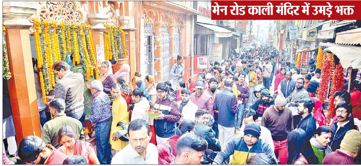
मेन रोड काली मंदिर में उमड़े भक्त