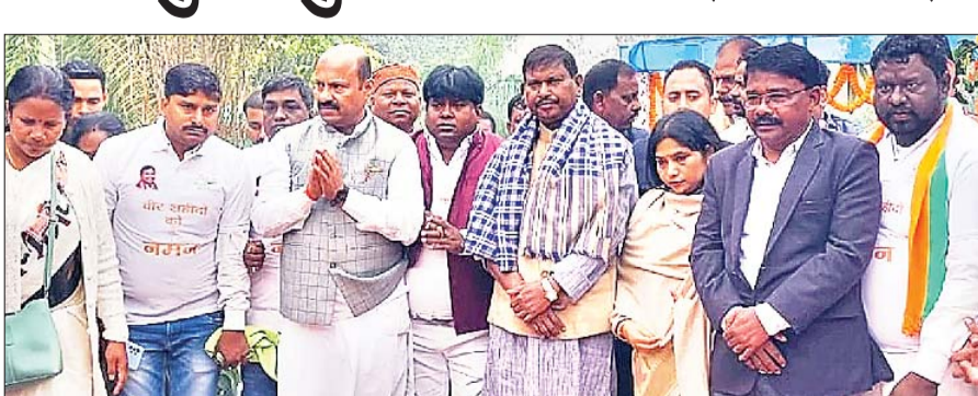
गोलीकांड की घटना हुई थी। यह आजाद भारत के इतिहास का सबसे भीषण गोलीकांड था, जिसमें सैकड़ों लोगों ने अपनी जान गंवायी थी। आदिवासी नेता जयपाल सिंह ने सरायकेला- खरसावां को ओड़िशा

खरसावां। खरसावां गोलीकांड की 75वीं बरसी पर शहीदों को श्रद्धांजलि दी गयी। शहीद स्थल पर पहुंच कर केन्द्रीय मंत्री अर्जुन मुंडा और राज्य के मंत्री चंपई सोरेन समेत कई नेताओं ने शहीदों को श्रद्धांजलि दी। खरसावां के इस ऐतिहासिक शहीद स्थल पर राज्य के कोने-कोने से भी पहुंच कर लोगों ने खरसावां गोलीकांड में मारे गये शहीदों को श्रद्धांजलि दी। आपको बता दें कि 1 जनवरी 1948 को खरसावां