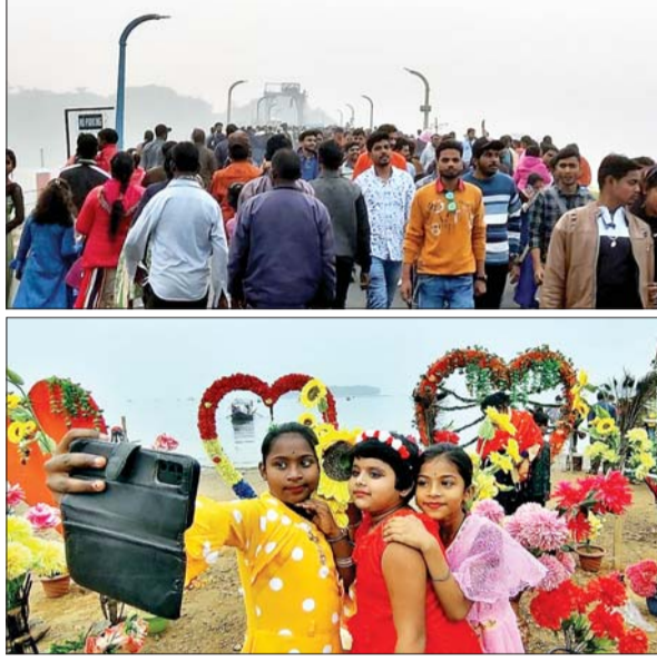
धनबाद कोयलांचल के विभिन्न पर्यटक स्थलों पर रविवार को नव वर्ष का आनंद उठाने के लिए उमड़ी सैलानियों की भारी भीड़। अलग-अलग जगहों पर रलों ने अपने-अपने तरीके से नववर्ष का आनंद उठाया।

धनबाद/चिरकुंडा। हैप्पी न्यू ईयर-हैप्पी न्यू ईयर की धुन में झुमा कोयलांचल। सर्द मौसम के थपेड़ों में भी लोगों का उत्साह चरम पर रहा। हालांकि मौसम के अचानक बदलाव से लोग जल्द ही अपने घरों को लौट चलें। लेकिन इसी बीच नये वर्ष की खुशियों का जमकर मजा लिया। बात अगर सैलानी स्थल मैथन व भटिंडा फॉल कि करें तो वहां लोगों का उत्साह चरम सीमा पर देखने को मिला। रविवार की सुबह सैकड़ों कि संख्या में जिले भर से लोगों का हजूम पिकनिक मनाने के लिए सारी समाग्री व्यवस्था के साथ वहां पहुंच अपने चयनित स्थानों पर जमने लगे। वे अपने साथ लाए खाद्य सामग्री का लुप्त लेने व हिन्दी गानों पर थिरकते हुए विशेष भोजन की प्रक्रिया में जुटे रहे। कमोबेश यही स्थिति जिले के सभी पार्कों व मैदानों में दिखा। वहीं जिले भर के मंदिरों में भी सुबह से श्रद्धालुओं की भारी भीड़ जुटी जो अपने परिजनों के संग वर्ष के पहले दिन की शुरुआत पूजा-अर्चना से की। जिले के कई समाजिक संस्था ने गरीब एवं जरूरतमंद लोगों व छोटे बच्चों के बीच मिठाईयां व गर्म कपड़े बांट उनके साथ नववर्ष की खुशियां मनाईं। जिले के मैथन, भटिंडा व पंक्ति डैम के अलावा बिरसा मुंडा पार्क, टाटा दोराबजी पार्क, गोकुल धाम, युनियन क्लब, गोलफ ग्राउंड आदि स्थानों पर नववर्ष की धूम मची रही।