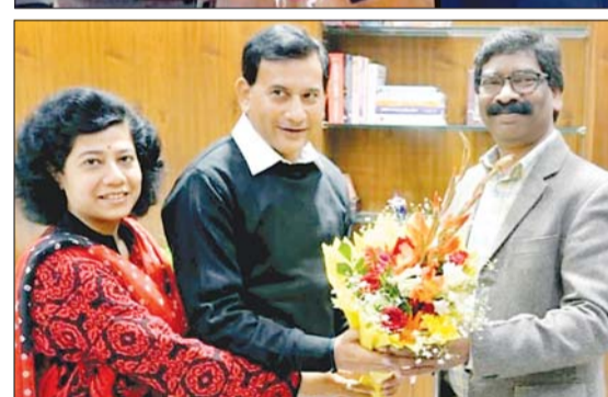
और शुभकामनाएं दीं। मौके पर की बधाई और मंगलकामनाएं दीं।