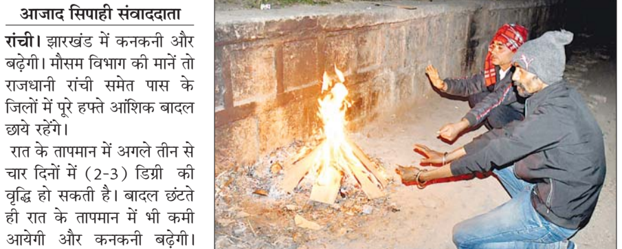
इस दौरान अधिकतम तापमान 23 से 24 डिग्री और न्यूनतम तापमान 10 से 12 डिग्री रहने की संभावना है।

रांची। झारखंड में कनकनी और बढ़ेगी। मौसम विभाग की मानें तो राजधानी रांची समेत पास के जिलों में पूरे हफ्ते आंशिक बादल छाये रहेंगे। रात के तापमान में अगले तीन से चार दिनों में (2-3) डिग्री की वृद्धि हो सकती है। बादल छंटते ही रात के तापमान में भी कमी आयेगी और कनकनी बढ़ेगी। मौसम विभाग की मानें तो 7 जनवरी तक मौसम ऐसा ही रहेगा। दिन में बादल छाये रहेंगे।