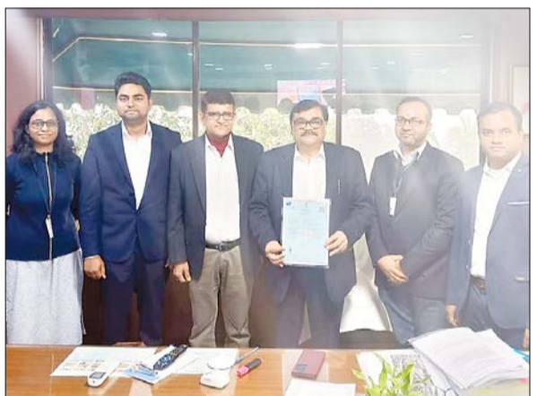
आजाद सिपाही संवाददाता

रांची। सेंट्रल माइन प्लानिंग एंड डिजाइन इंस्टीट्यूट लिमिटेड, एक मिनी रत्न (श्रेणी-1) कंपनी और कोल इंडिया लिमिटेड की पूर्ण स्वामित्व वाली सहायक कंपनी ने धूल के उत्पादन और उड़ने की प्रक्रिया को नियंत्रित करने के लिए एक प्रणाली विकसित करने के अपने अभिनव कार्य के लिए पेटेंट हासिल किया है। यह पेटेंट 30 दिसंबर, 2022 को द पेटेंट ऑफिस, इंटेलेक्चुअल्स पॉपर्टी इंडिया, भारत सरकार द्वारा प्रदान किया गया। इस मौके पर सीएमपीडीआइ के अध्यक्ष-सह-