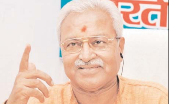
मंडल अध्यक्ष, जिलों में निवास निकायों के महापौर, उप महापौर, अध्यक्ष, उपाध्यक्ष, सभी मोर्चों के

आजाद सिपाही संवाददाता रांची। राज्यसभा में भाजपा के मुख्य सचेतक, पार्टी के प्रदेश प्रभारी सांसद डॉ लक्ष्मीकांत वाजपेयी आगामी 7 जनवरी से झारखंड के चार जिलों में सांगठनिक प्रवास पर रहेंगे। यह जानकारी पार्टी के प्रदेश महामंत्री एवं सांसद आदित्य साहू ने दी। उन्होंने बताया कि डॉ वाजपेयी अपने सांगठनिक प्रवास के क्रम में वे अलग अलग जिलों के सांसद, विधायक, पूर्व सांसद, पूर्व विधायक, मंडल अध्यक्ष, पूर्व