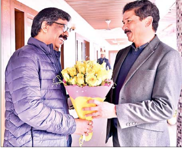
रांची (आजाद सिपाही)। मुख्यमंत्री हेमंत सोरेन को बुधवार को कांके रोड रांची स्थित मुख्यमंत्री आवास पर कार्यलय में प्रधान सचिव राजीव अरण एक्का ने पुष्पगुच्छ भेंट कर नववर्ष की हार्दिक बधाई दी।