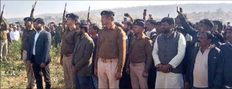
अंतिम सलामी देते पुलिस के जवान तथा मौके पर मौजूद डीसी-एसपी एवं अन्य

देहाती का शनिवार शाम रिस्स में इलाज के दौरान निधन हो गया था। सांस लेने में तकलीफ और यूरिन की समस्या के बाद उन्हें रांची के रिस्स में इलाज के लिए भर्ती कराया गया था। पिछले करीब 30 दिनों से उनका इलाज रांची में चल रहा था। स्वास्थ्य