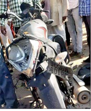
धमाके के बाद मौके पर मची अफरातफरी, बंद होने लगी दुकानें