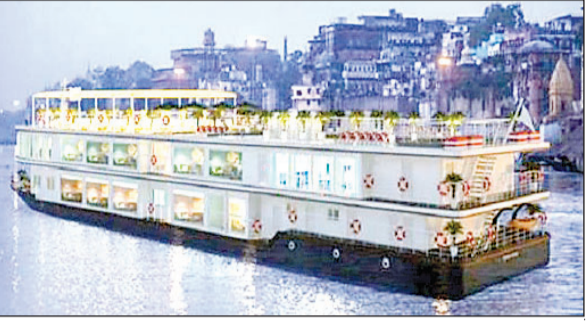
स्विट्जरलैंड के 32 पर्यटक करेगे पहली यात्रा

नयी दिल्ली। प्रधानमंत्री नरेंद्र मोदी 13 जनवरी को वाराणसी से दुनिया के सबसे लंबे रिवर क्रूज 'एमवी गंगा विलास' को हरी झंडी दिखाएंगे। एक आधिकारिक बयान में यह जानकारी दी गयी। बयान में कहा गया है कि लम्बी क्रूज भारत और बांग्लादेश के पांच राज्यों में 27 नदी प्रणालियों में 3,200 किलोमीटर से अधिक की दूरी तय करेगा। बयान में केंद्रीय बंदरगाह, नौवहन और जलमार्ग मंत्री सर्वानंद सोनोवाल के हवाले से कहा गया है कि एमवी गंगा विलास भारत को दुनिया के नदी क्रूज मानचित्र पर लायेगा।