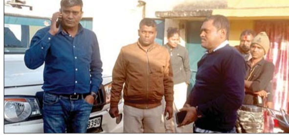
बरोरा में हत्या की संदिग्ध महिला की तलाश करती पटना पुलिस।