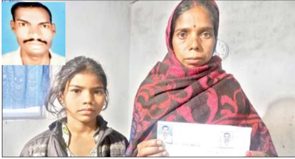
मृतक की पत्नी एवं बच्ची