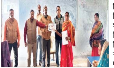
विश्रामपुर/पलामू (आजाद सिपाही)। प्रधानमंत्री पोषण शक्ति निर्माण योजनांतर्गत विश्रामपुर प्रखंड के सभी विद्यालयों में कार्यरत रसोइया को सहायिका का एकदिवसीय गैर आवासीय प्रशिक्षण रविवार को रेहला बुनियादी विद्यालय परिसर स्थित बीआरसी में भवन में संपन्न हुआ। जहां प्रखंड में कार्यरत 243 रसोइया सह सहायिका में से 195 को प्रशिक्षित किया गया। शिविर में रसोइया को विद्यालयों में संचालित मध्यान भोजन को और भी बेहतर बनाने की गुर सिखाए गए।