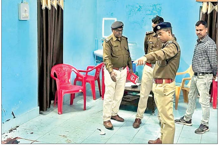
घटनास्थल यूनियन कार्यालय में मामले की जांच-पड़ताल करती पुलिस।