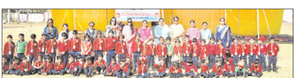
संगठन/संबलपुर मंडल की कार्यक्रम के दौरान सभी छात्रों ने विभिन्न खेल गतिविधियों में भाग लिया।

भुवनेश्वर (आजाद सिपाही)। पूर्व तट रेलवे महिला कल्याण संगठन द्वारा संचालित जैक एन जिल स्कूल का दो दिवसीय वार्षिक खेल कार्यक्रम 9 और 10 जनवरी 2023 को आयोजित किया गया था। इस कार्यक्रम में पूर्व तट रेलवे महिला कल्याण