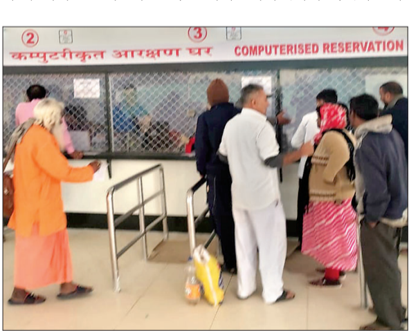
के पास स्थानांतरित कर दिया गया है। पुरी रेलवे स्टेशन पर यात्रियों की जरूरतों को पूरा करने के लिए रेल सुरक्षा बल और सरकारी रेल

आजाद सिपाही संवाददाता भुवनेश्वर। स्टेशन भवन के पुनर्विकास कार्य के लिए पुरी रेलवे स्टेशन की टिकट बुकिंग प्रणाली को स्थानांतरित किया गया। पुरी रेलवे स्टेशन को विश्व स्तरीय बुनियादी ढांचे और यात्रियों के अनुकूल सुविधाओं के साथ पुनर्विकास किया जा रहा है। पुरी रेलवे स्टेशन के प्रस्तावित पुनर्विकास कार्य की देखरेख के लिए कैम्प कार्यालय को हाल ही में चालू किया गया है। चल रहे पुनर्विकास कार्य को देखते हुए, पुरी रेलवे स्टेशन पर टिकट बुकिंग प्रणाली को एक नए स्थान पर अर्थात् रेल सुरक्षा बल और सरकारी रेल पुलिस बल कार्यालय