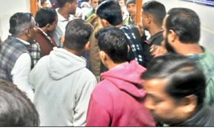
आरोपियों की तलाश में पुलिस कर रही है छापेमारी