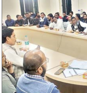
सीसीएल प्रबंधन व रैयत विस्थापित मोर्चा की बैठक में उपस्थित प्रतिनिधि

आजाद सिपाही संवाददाता पिपरवार। सीसीएल पिपरवार क्षेत्र के महाप्रबंधक कार्यालय में शुक्रवार को सीसीएल प्रबंधन और रैयत विस्थापित मोर्चा के बीच सात सूत्री मांगों को लेकर बैठक हुई। जिसमें रैयत विस्थापित मोर्चा की ओर से प्रबंधन को सौंपे गए मांगों पर विस्तारपूर्वक चर्चा की गई। इसमें मुख्य रूप से विस्थापित रैयतों को रोजगार के लिए कोयला उत्पादन का 50 फीसदी कोयला रोड सेल में देने, विस्थापितों को एक करोड़ तक का ठेका कार्य देने, नीजि कंपनियों में 75 फीसदी काम विस्थापितों को देने, रैयतों की अधिकृत भूमि के बदले लॉबित नौकरी और मुआवजा देने,