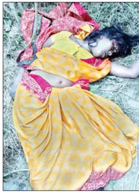
विगत दो जनवरी को बुंदू व तमाड़ में जंगली हाथियों का तांडव महिला की कुचल कर ली जान, खेत रौंदे