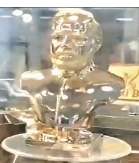
गोल्ड प्रदर्शनी का है। मोदी की सोने की मूर्ति घूमती हुई दिख रही है।

मुंबई। प्रधानमंत्री नरेंद्र मोदी की सोने की मूर्ति चर्चा में है। बांबे गोल्ड प्रदर्शनी में एक कलाकार ने 156 ग्राम सोने की मूर्ति बनायी है। इस सोने की मूर्ति का वीडियो वायरल होने के बाद लोगों ने कहा कि प्रधानमंत्री मोदी की लोकप्रियता मेगा स्टार अमिताभ बच्चन और रजनीकांत से भी ज्यादा है। पीएम मोदी की सोने की मूर्ति का वीडियो दो दिन पहले हुई बांबे