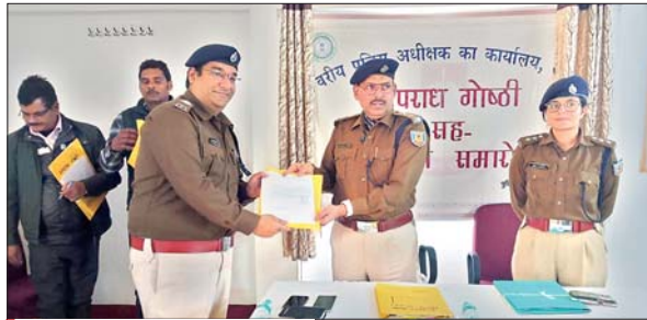
मैकलुस्कीगंज में जिला ग्रामीण पुलिस अपराध गोष्ठी सह सम्मान समारोह आयोजित