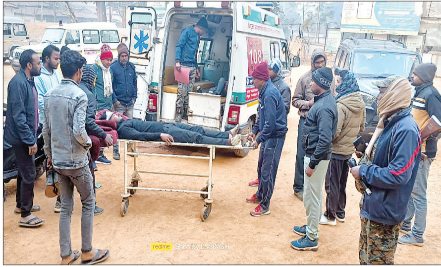
दुर्घटना में घायल छात्र को एंबुलेंस से अस्पताल ले जाते रेस्क्यू टीम के सदस्य।