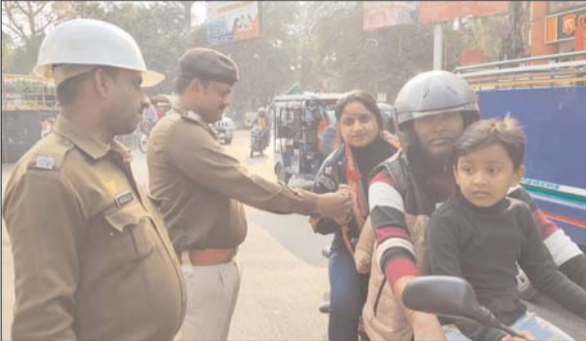
बिना हेलमेट लगाए बाइक सवार को गुलाब फूल देकर जागरूक करते पुलिस कर्मी।

धनबाद। जिले के विभिन्न क्षेत्रों में शनिवार को ट्रैफिक पुलिस की गांधीगिरी देखने को मिली। सड़क सुरक्षा सप्ताह के तहत धनबाद ट्रैफिक पुलिस ने सड़कों पर बिना हेलमेट पहने बाइक चलाने और यातायात नियमों का उल्लंघन करने वाले चालकों को गुलाब फूल देकर उन्हें उनकी गलती का एहसास कराया। इस दौरान दर्जनों महिला और पुरुष चालक बिना हेलमेट के वाहन चलाते दिखे, जिन्हें कानून का पाठ पढ़ाया गया। ट्रैफिक डीएसपी ने कहा कि पुलिस के डर से हेलमेट पहना जरूरी