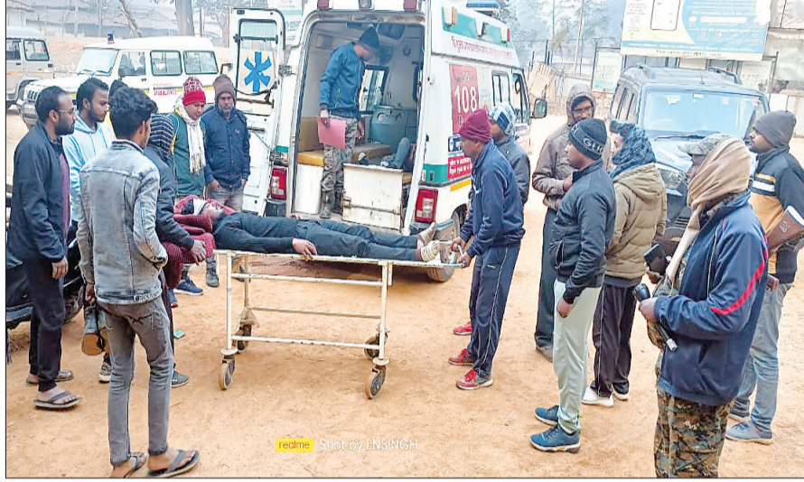
दुर्घटना में घायल छात्र को एंबुलेंस से अस्पताल ले जाते रेस्क्यू टीम के सदस्य।