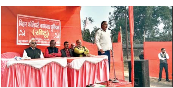
सभा को संबोधित करते यूनियन के पदाधिकारी।

झरिया। बीसीसीएल लोदना प्रबंधन के तानाशाही रवैया और आउटसोर्सिंग प्रबंधन से मिलीभगत कर क्षेत्र की मूलभूत सुविधा को निरस्त करने के षड्यंत्र के विरोध में शुक्रवार को कुजामा कॉलियरी के समक्ष बिहार कॉलियरी कामगार यूनियन एवं डीवाइएफआई ने संयुक्त रूप से आम सभा की। मुख्य वक्ता के रूप में सीटू के केंद्रीय उपाध्यक्ष कामरेड सुंदरलाल महतो भी उपस्थित थे। उन्होंने कहा कि बीसीसीएल अधिकारी आउटसोर्सिंग ठेकेदार से मिलीभगत कर अवैध धंधा संचालित कर रहे हैं। यही सब कारण है कि यहां के लोगों को