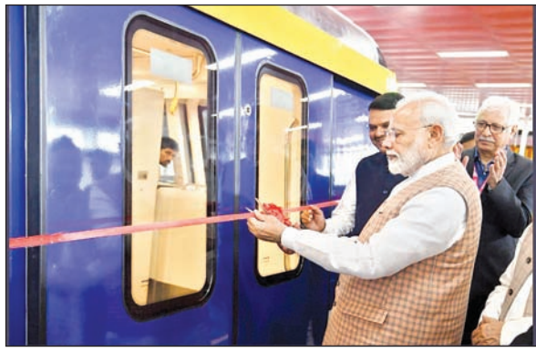
द्वारा स्टेनलेस स्टील उपलब्ध कर रही है। इस ट्रेन सेट का निर्माण भारत अर्थ मूवर्स लिमिटेड (बीइएमएल) अनेक बैच में कर

एक समर्पण समारोह के दौरान किया। यह मेट्रो लाइन आज से जनता के लिए चालू की जायेगी। इस मुंबई मेट्रो परियोजना के लिए जिंदल स्टेनलेस ने विभिन्न टैपर और 2जे फिनिश वाले 301एलएन श्रेणी के उच्च गुणवत्ता वाले स्टेनलेस स्टील की आपूर्ति की। जनवरी 2021 में शुरू हुई यह आपूर्ति, दिसंबर 2025 तक जारी रहेगी। इस परियोजना के लिए जिंदल स्टेनलेस देश के अलग अलग राज्यों में स्थित अपने विभिन्न मैनुफैक्चरिंग प्लांट्स के