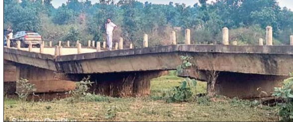
फोटो : क्षतिग्रस्त पुल