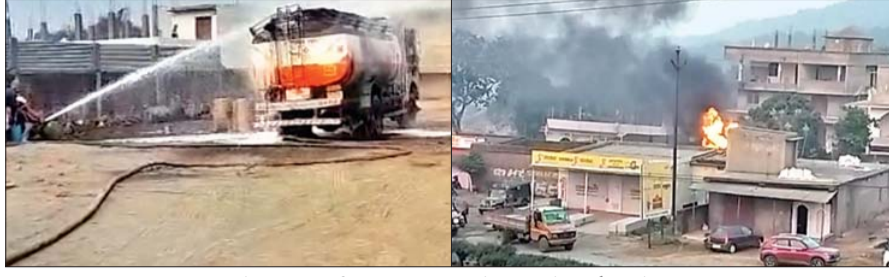
आग बुझाते दमकलकर्मी तथा रिहायशी इलाके की बीचोंबीच टैंकर में लगी आग।