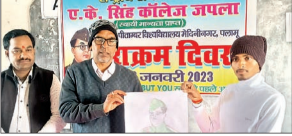
छात्र-छात्राओं को सम्मानित करते नोडल पदाधिकारी

हुसैनाबाद : भारत सरकार के युवा कार्यक्रम एवं खेल मंत्रालय राष्ट्रीय सेवा योजना क्षेत्रीय निदेशालय पटना के निदेशानुसार सोमवार को राष्ट्रीय सेवा योजना इकाई ए के सिंह कॉलेज जपला के तत्वावधान में नेताजी सुभाष चन्द्र बोस जी की 126 वीं जयंती को महाविद्यालय में पराक्रम दिवस के रूप में मनाया गया इस अवसर पर महाविद्यालय में भाषण प्रतियोगिता, निबंध प्रतियोगिता एवं पेंटिंग प्रतियोगिता का आयोजन