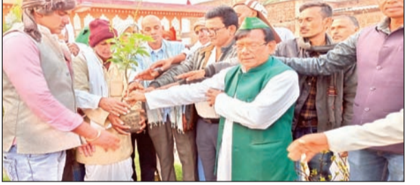
आजाद सिपाही संवाददाता

मृतक के पिता ने 40 वर्ष पूर्व मैं अपने परिजनों को सुरक्षा का दिया था जिम्मा : कौशल