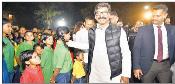
अनुसूचित जनजाति आवासीय बालिका उच्च विद्यालय चाइबासा में सीएम हेमंत सोरेन।