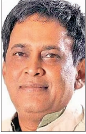
अवसरप्राप्त न्यायाधीश नियुक्त